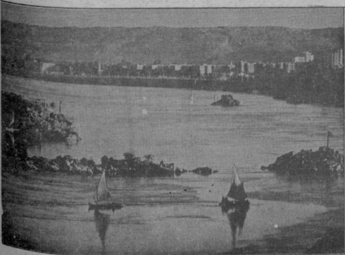
Una bellísima panorámica del famoso río Nilo a su paso por la ciudad egipcia de Assuan.

Con experiencia de 11 años; residencia en Segovia. Interesados escribir al Apartado Correos 146, SEGOVIA.