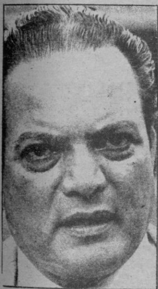
Luis Alberto Monge

San José.—El candidato socialdemócrata Luis Alberto Monge Alvarez, del Partido Liberación Nacional, se ha proclamado presidente electo de Costa Rica. Desde los primeros datos oficiales, Monge Alvarez mantiene a su favor de más del sesenta por ciento de los votos emitidos durante el día de ayer.