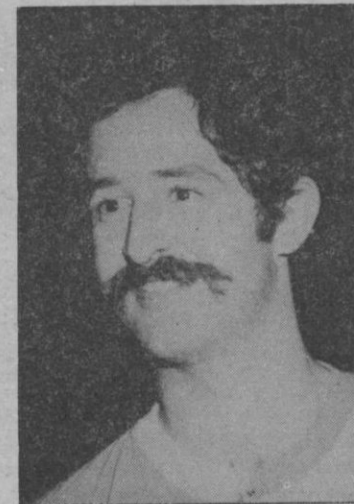
BRAVO: Máximo anotador

el motivo ya está expuesto—, el conjunto local. De cualquier forma hay que hacer notar que el partido fue bien jugado por ambos conjuntos. La primera parte no tuvo alternativas excesivas en el marcador. El juego estaba muy igualado y el marcador, tras los treinta minutos de juego, tenía un empate a