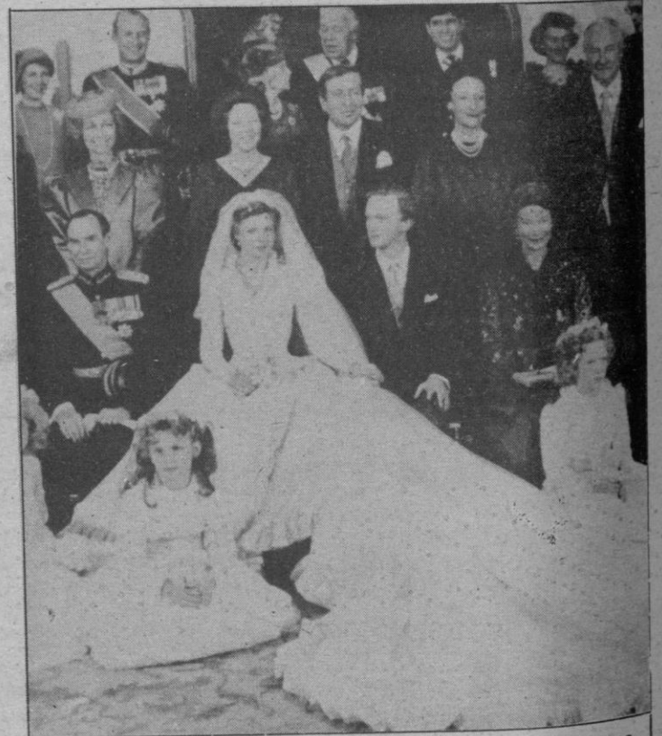
LUXEMBURGO. —Foto oficial de la boda de la Princesa Marie-Astrid de Luxemburgo y el Archiduque austriaco Christian. En la primera fila, de izquierda a derecha, aparecen: El Gran Duque Jean de Luxemburgo, la pareja desposada y la Gran Duquesa Josephine. En la segunda fila: la Reina de España, Doña Sofía; la pareja real holandesa, Beatriz y Claus, y la Princesa y el Príncipe Napoleón. En la tercera línea: los Príncipes de Noruega, el Príncipe y la Princesa Beril de Suecia, el Príncipe Andrew de Inglaterra y el Duque y Duquesa de Gloucester.

ES «MINIMA» LA POSIBILIDAD de que la selección española de fútbol gane el próximo Campeonato Mundial, opina el comentarista deportivo del periódico chino «Wen Hui», de Shanghai.