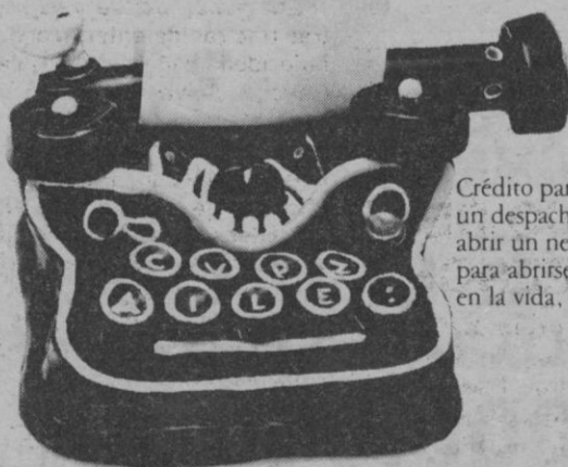
Crédito para abrir un despacho, para abrir un negocio... para abrirse camino en la vida. ¡en suma!