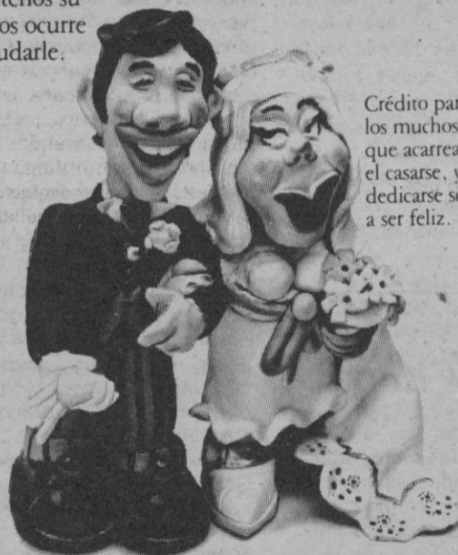
Crédito para olvidar los muchos gastos que acarrea el casarse, y dedicarse sólo a ser feliz.