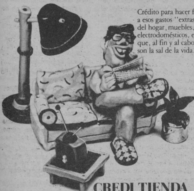
Crédito para hacer frente a esos gastos "extras" del hogar, muebles, electrodomésticos, etc. que, al fin y al cabo, son la sal de la vida...