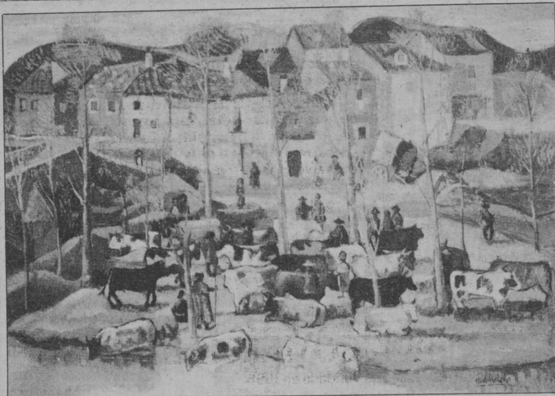
«Feria de ganado», un bello cuadro de Redon del que se conserva en el Museo de Arte Contemporáneo.