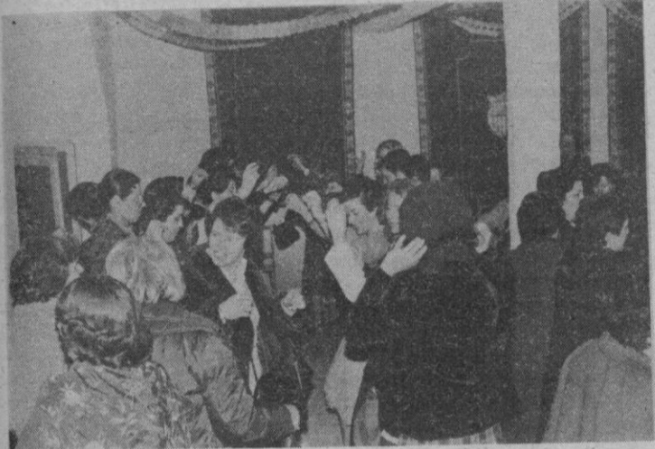
Un momento del baile, que resultó muy animado ya que participaron la totalidad de las asistentes