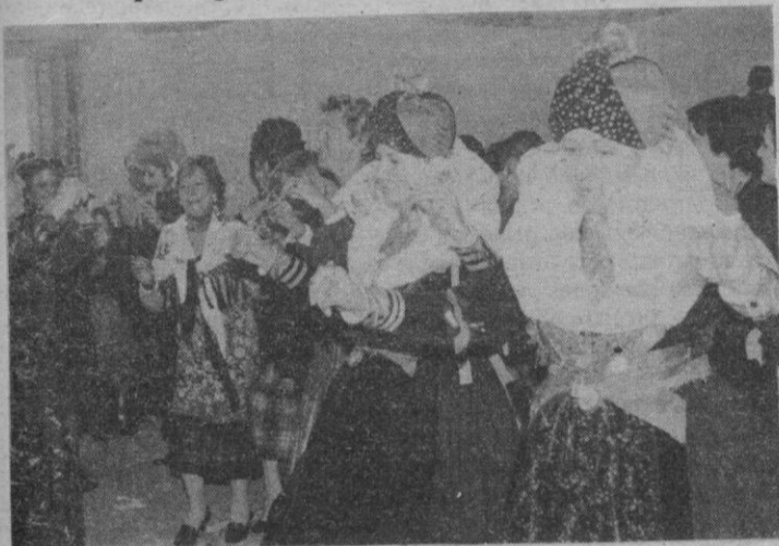
Las alcaldesas vestían el traje de austeridad en memoria de sus antecesoras difuntas