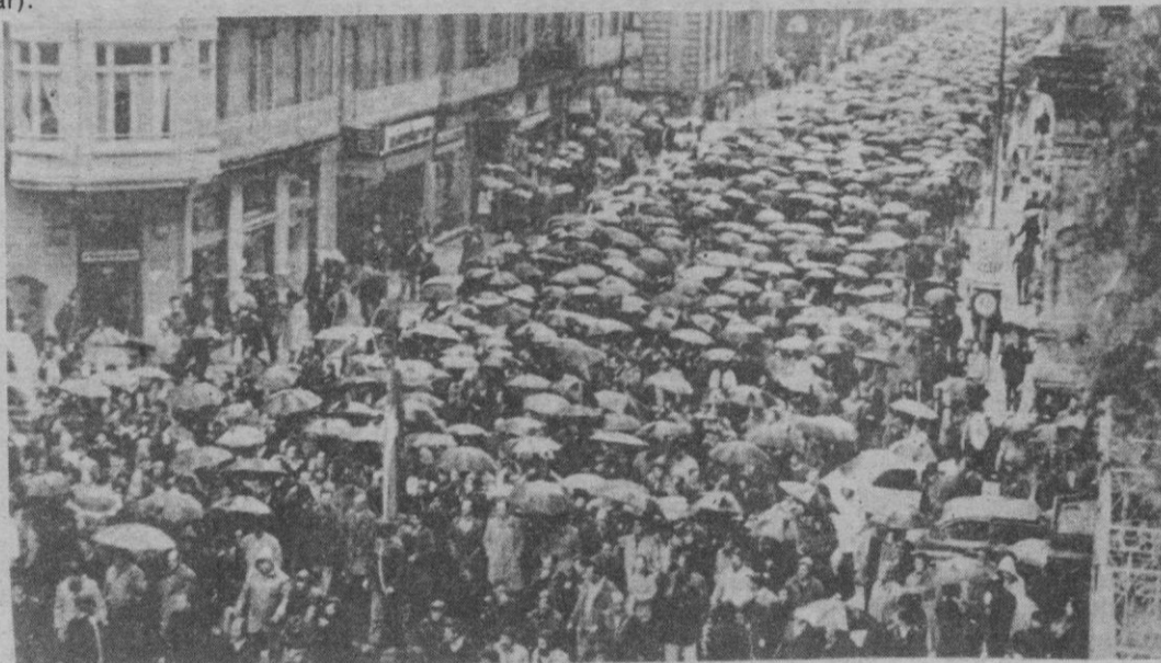
Un aspecto de la manifestación de ayer en San Sebastián, en la que participaron decenas de miles de personas.