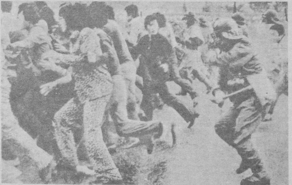
Durante tres días consecutivos se suceden los enfrentamientos entre estudiantes y tropas del Ejército y de la Policía en la capital sudcoreana de Seúl y en otras ciudades del país. Ochenta mil estudiantes exigen la abolición de la ley marcial, desafían al Gobierno y exigen su dimisión, mientras soldados armados con fusiles automáticos y con las bayonetas caladas, respaldados por una veintena de carros blindados, tratan de proteger los edificios oficiales. Detenciones y heridos se cuentan por centenares.

La emisora libanesa informó también que cañoneras israelíes bombardearon durante la noche del jueves al viernes varios barrios de la ciudad portuaria de Tiro, a unos 80 kilómetros al sur de Beirut, así como los cercanos campos de refugiados de Al Bass y Rashidiyeh, dejando gran número de heridos.