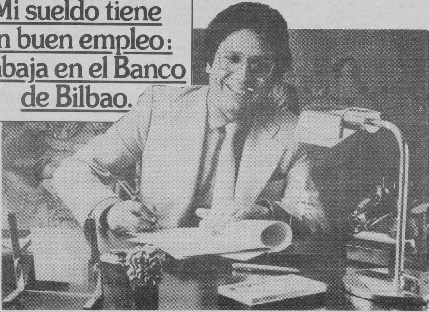
© MMLB Banco de Bilbao 80 B

Mi sueldo tiene un buen empleo: Trabaja en el Banco de Bilbao.