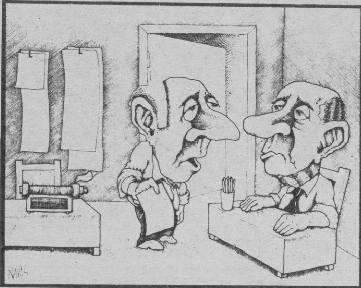
—Iba a escribir este editorial diciendo que disfrutamos de libertad de expresión, pero no lo haré no sea que nos cueste un disgusto