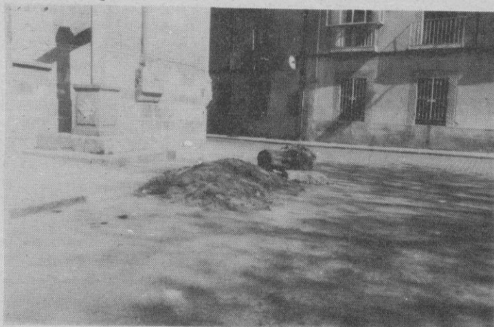
Una muestra de la dejadez que hay en algunos servicios municipales, la tenemos en la