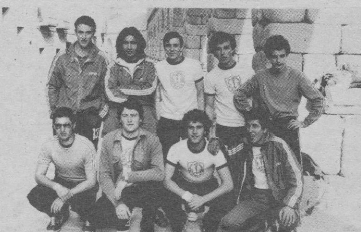
Colegio Diocesano, de Avila