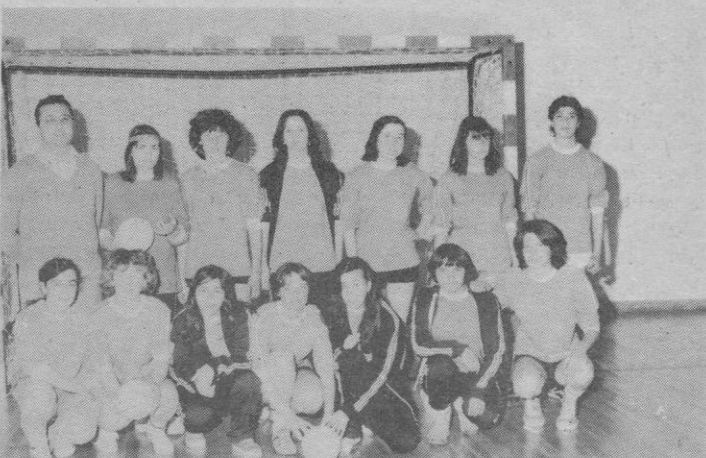
Instituto de Bachillerato, de Cantalejo (cadetes)