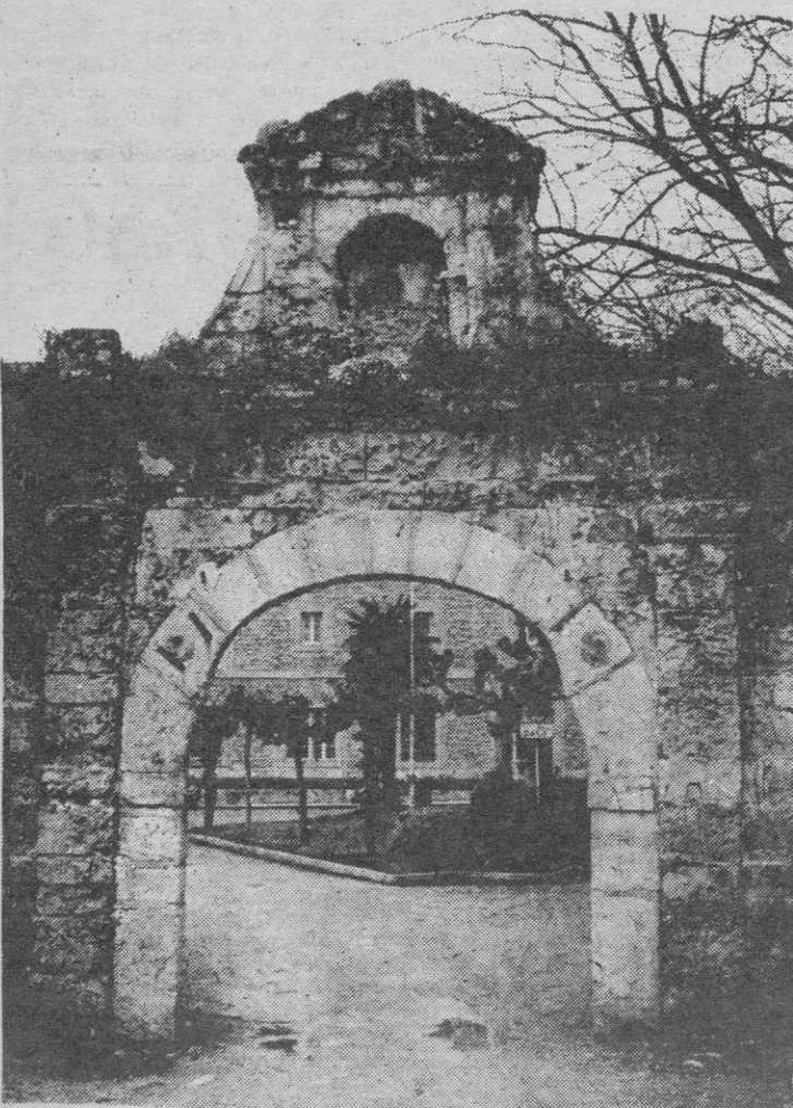
San Román de la Llanilla, aliviadero de Santander, distante tan sólo cuatro kilómetros, ocupa hoy con su historia y sus problemas las mentes de miles de santanderinos que allí van a buscar una casita. En la fotografía, de Pablo Hojas puede verse la portalada del seminario y antiguo monasterio de Monte Corbán.