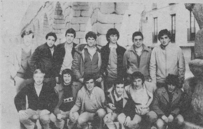
Instituto «Fray Luis de León», de Salamanca