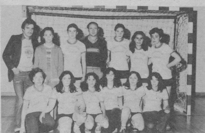
Agrupación Escolar Mixta, de Serranillos (Avila)