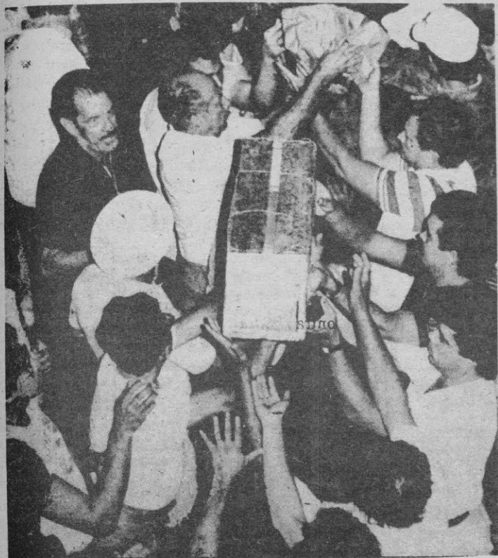
Exiliados cubanos en Miami recogen alimentos para enviarlos a sus compatriotas que esperan en la Embajada peruana de La Habana permiso para salir de la isla. Los exiliados protagonizaron ayer una manifestación en apoyo de los refugiados.

Lima, 8.—La impotencia para tomar medidas efectivas sigue dominando en la Cancillería peruana ante el caso de su Embajada en La Habana, en la que se encuentran miles de refugiados.