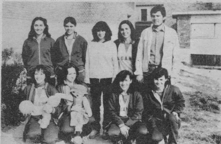
Instituto Leopoldo Cano, de Valladolid.