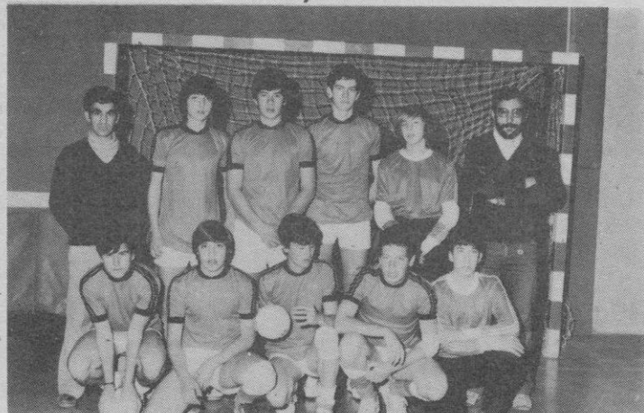
Colegio «María Auxiliadora», de Salamanca