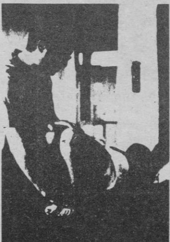
Y ellos precisan trato más cuidadoso que cualquier otro ser humano.

Una sociedad se mide por la manera en que trata a sus seres más débiles.