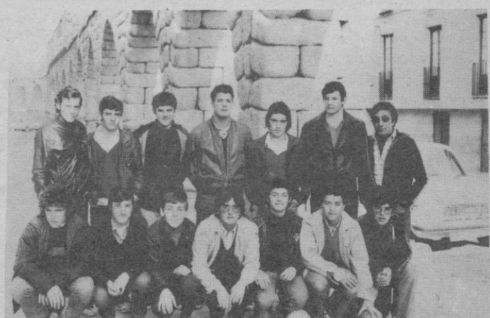
Colegio «San Agustín», de Palencia