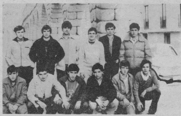
Colegio «Corazón de María», de Zamora