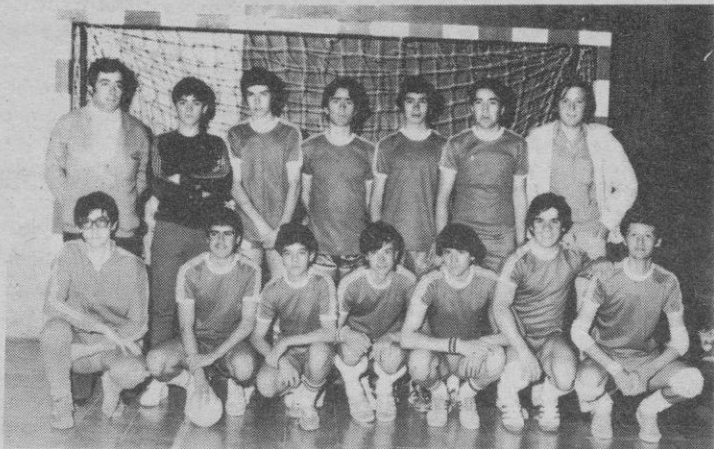
Instituto «Giner de los Rios», de Segovia

tivos «Enrique Serichol» y «Emperador Teodosio» hasta el próximo jueves, en horario de mañana y con entrada gratuita. Los equipos, femeninos y masculinos, son de las categorías cadete y juvenil, y en este reportaje de Antonio vemos a diez de ellos; mañana completaremos el cuadro.