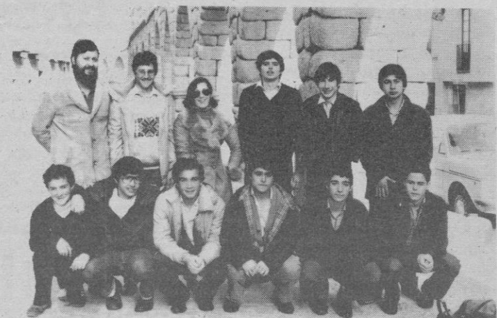
Colegio Marista, de Valladolid