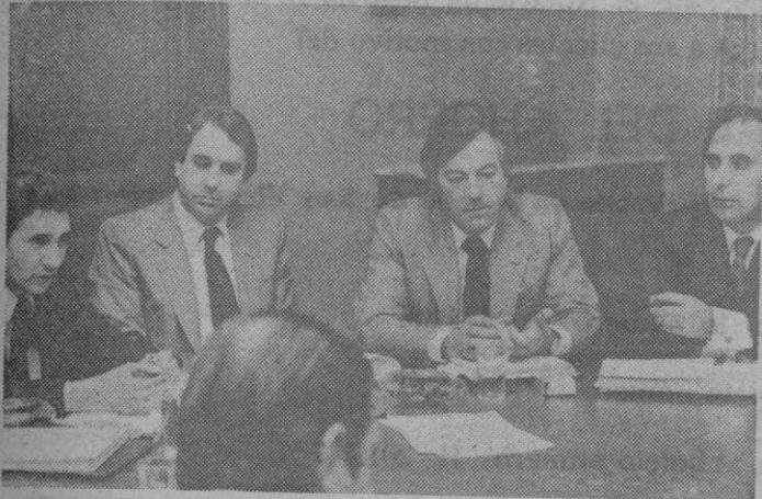
De izquierda a derecha, el delegado del MOPU en Segovia, representante del Consejo de Castilla-León, presidente de la Diputación, subdirector general y otros delegados, durante el transcurso de la reunión.

Como ya informamos, en la mañana de ayer se reunieron los delegados del Ministerio de Obras Públicas y Urbanismo de la región, incluidas las provincias de León, Santander, y Logroño, con el subdirector general de Acción Territorial, señor Soto Cuenca, para tratar acerca de la reestructuración y futuro funcionamiento de las delegaciones del MOPU. El propio subdirector general informó del reciente decreto sobre la declaración a la región castellano-leonesa de zona de gran