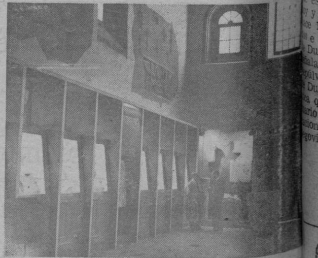
Una perspectiva de la Capilla del Hospital de Vieja cuando en ella se encontraba instalado el Museo Arqueológico Segoviano

5) Segovia. "Torreón de Lozoya" de la Caja de Pensiones y Monte de Piedad.—Organizada por la Dirección General de Bellas Artes, a través de la Comisaría General de Excavaciones Arqueológicas, el 24 de agosto inauguró por el director general de Bellas Artes, el antiguo gobernador civil de Segovia desde cuyo cargo