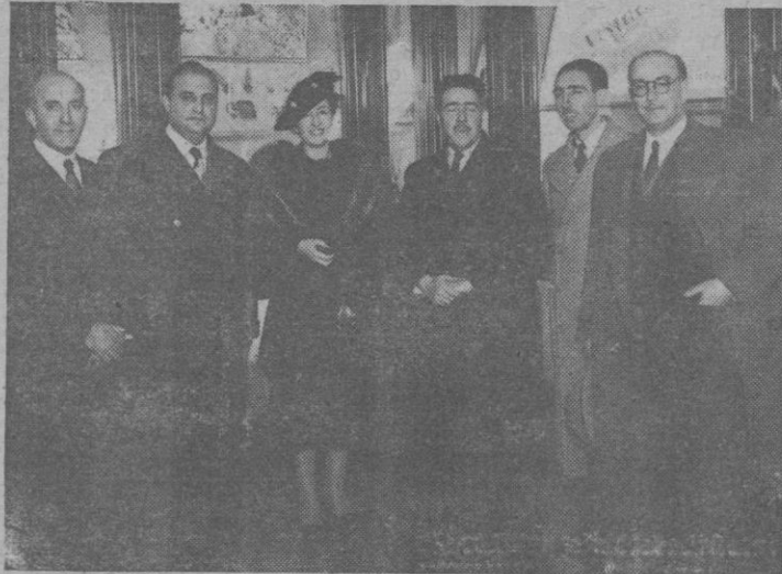
Personalidades asistentes a la inauguración de la exposición celebrada en 1950 en la Biblioteca Nacional

En artículos anteriores hemos tratado de los documentos y artículos periodísticos referentes al descubrimiento de la necrópolis en marzo de 1959 (1); de los hallazgos casuales en 1937 y Excavaciones de Plan Nacional 1942, 1943, 1944, 1945, 1946 y 1948 (a costa de la Diputación Provincial la primera de estas campañas y a cargo del Estado las restantes) (III); de la curiosidad e interés que las excavaciones suscitaron en su tiempo, en la comarca y provincia (III); y, por último, de la incorporación de los hallazgos a la cultura mediante publicaciones, conferencias, prensa y radio, y opiniones prestigiosas sobre aquéllos (IV), quedándonos por tratar las exposiciones y la ubicación e importancia comparativa de los objetos, lo que seguidamente vamos a hacer.