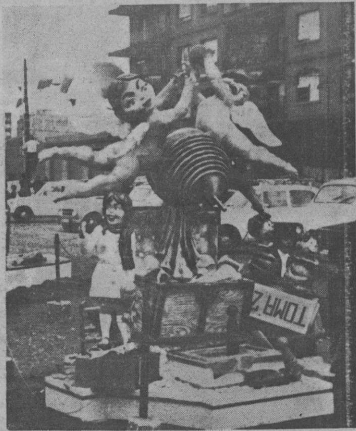
Así era la pequeña y simpática falla infantil de la plaza de Segovia

Segundo, las "mascletás". Cada falla tiene sus "mascletás" y cada jornada fallera también, con carácter extraordinario, en la plaza principal, la del Caudillo, a las dos de la tarde. Impresionante "llenazo" (¿500.000, 600.000?). Cientos de cohetes de todo tipo, de toda potencia. Y