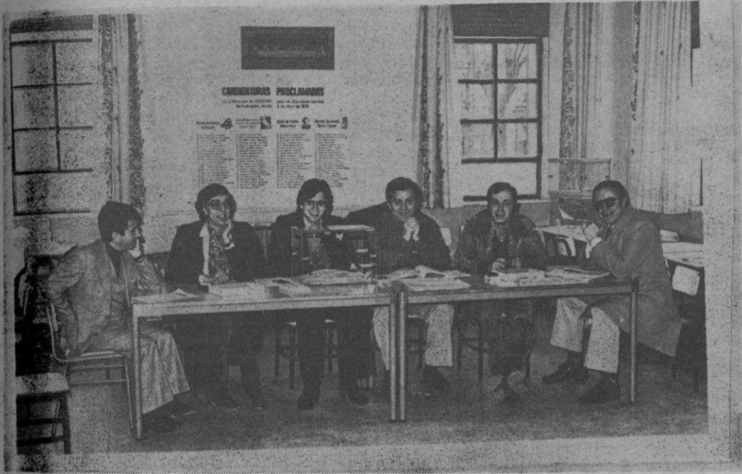
UN DESCANSO EN EL TRABAJO. Los componentes de una de las mesas electorales esperan el voto de los electores; como no parecía haber prisa por parte del público, queda tiempo para sonreír al fotógrafo.

ELECCIONES '79 Del 10 al 18 próximos, constitución de la Diputación; los ayuntamientos, del 18 al 22 En junio se celebrarán elecciones parciales en los cuatro pueblos donde no se presentaron candidaturas