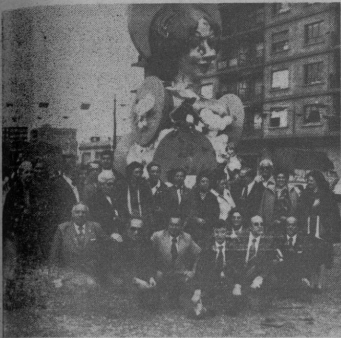
He aquí, junto al alcalde de Segovia, al grupo de segovianos que acudió a las fiestas falleras de San José, fotografiados ante la falla de la plaza de Segovia