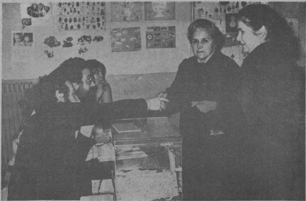
LA ABSTENCION, PROTAGONISTA. Un hecho significativo de la jornada fue la abstención de un considerable número de electores. No obstante, hubo quien cumplió con este derecho y deber, como estas dos mujeres.

Asimismo, nuestro agradecimiento a los representantes de los partidos políticos y coaliciones de la capital, que también estuvieron prestos a colaborar para una mayor información destinada a nuestros lectores.