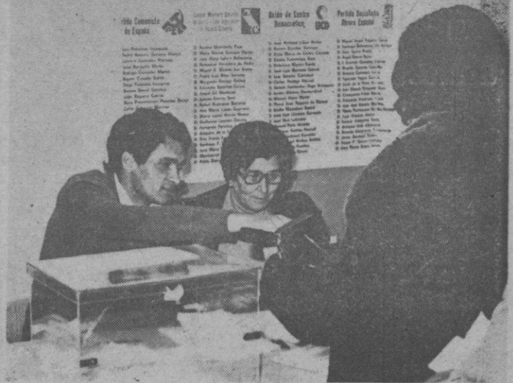
AL FONDO, LOS CANDIDATOS. En una de las mesas se comprueba la identidad de un elector; al fondo, las cuatro candidaturas que se presentaban en Segovia. Desde ayer ya se sabe quiénes van al Ayuntamiento.

Las sesiones serán públicas. El cargo de alcalde es incompatible con el de presidente de la Diputación.