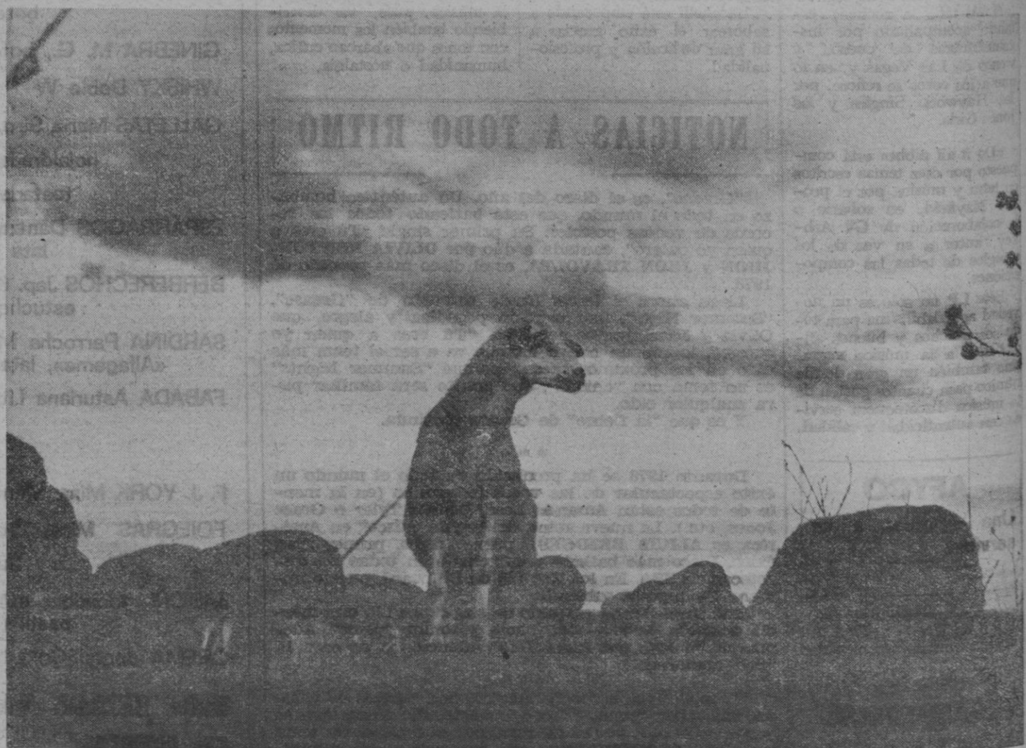
"Presumido", obra original de Amando Carabias Pascual de Segovia. Condiciones para publicación: En blanco y negro y tamaño 18x24 (para reducir a conveniencia), indicando nombre, domicilio, D.N.I. del autor y título de la obra, que quedará en poder del periódico.