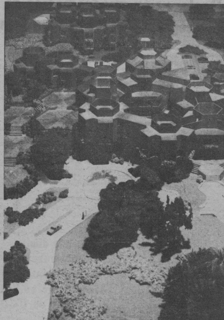
Maqueta del conjunto arquitectónico de la Embajada de España en Brasilia, obra de Rafael Leoz.

La tierra es roja en toda la extensión de la meseta central, de este país-continente tantas y tantas veces cantado en prosa y verso, ya desde los primeros momentos de su historia.