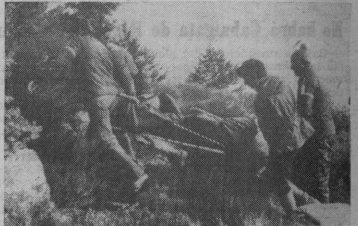
Un momento del rescate de las víctimas