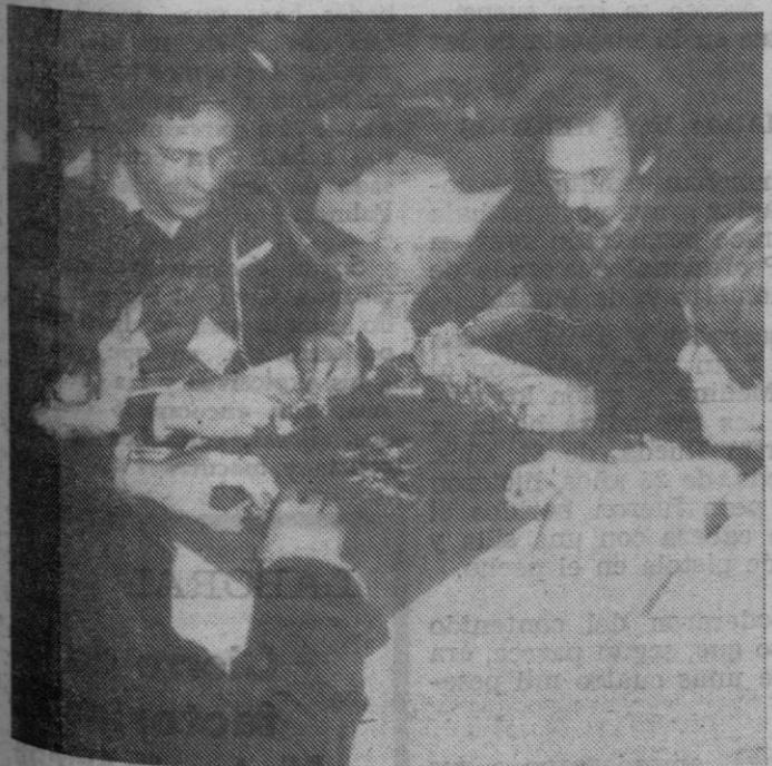
Dos de las parejas participantes en el campeonato, en "plena partida".

38 parejas participan en el campeonato de mus, ya habitual por estas fechas, que el hotel Victoria ha organizado coincidiendo con la época de Navidad.