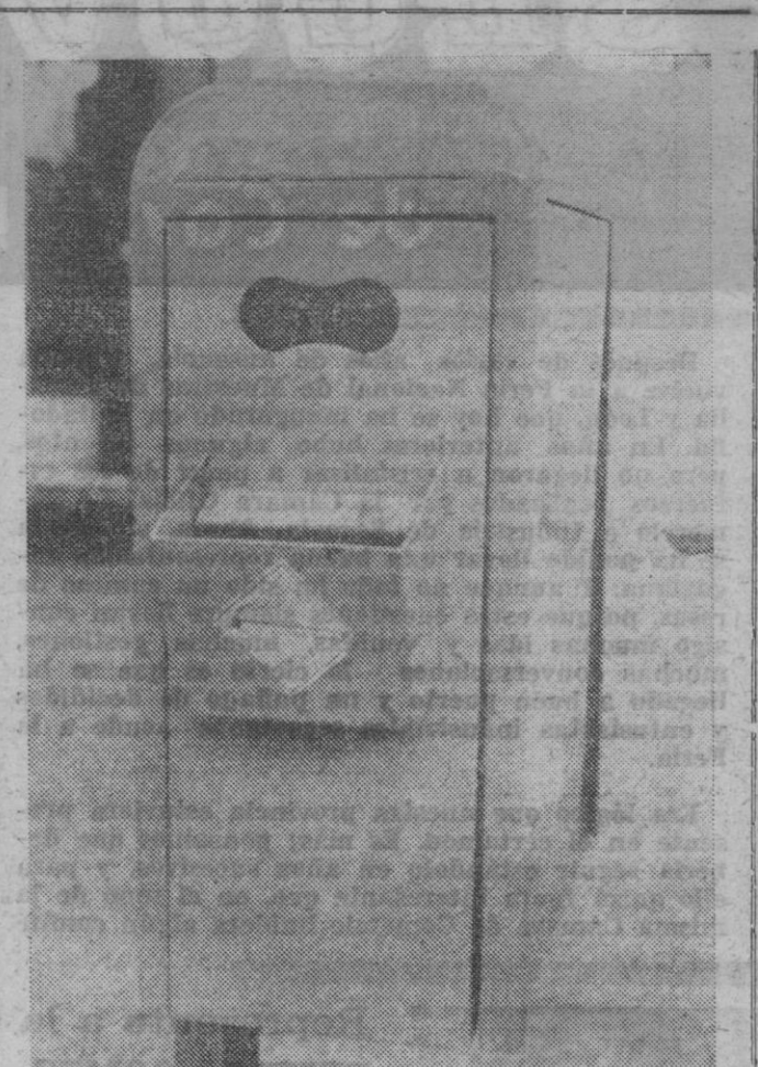
Madrid lucha por la limpieza en la ciudad. Hace tiempo, el Ayuntamiento acordó sancionar con 1.000 pesetas de multa el arrojar papeles o una simple colilla de cigarrillo a la calle. Para ello ha colocado estos días ceniceros junto a las papeletas. Así no hay excusa. Algo de esto, de este esfuerzo de limpieza, está haciendo falta en otra ciudad que todos sabemos...