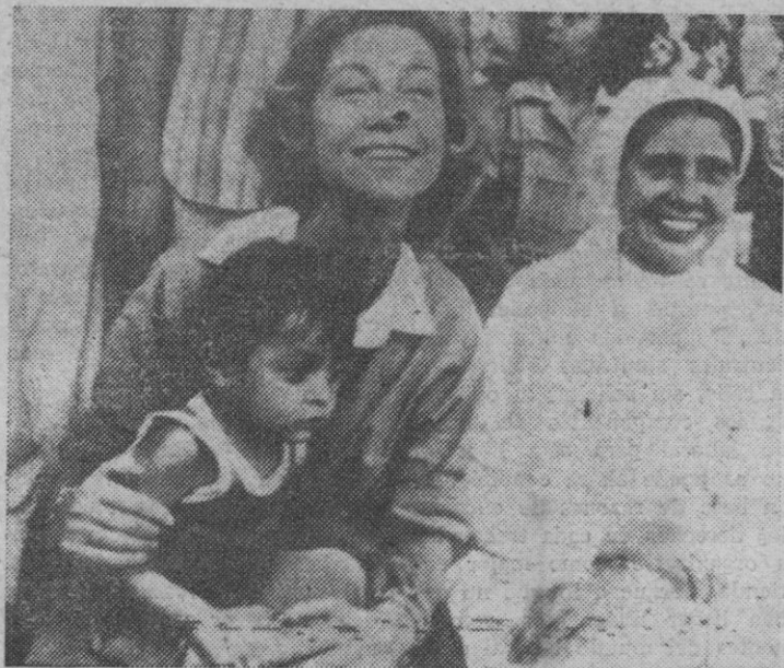
Durante la visita a la ciudad maya de Tikal, en la jungla de Guatemala, la Reina de España, doña Sofía, aparece teniendo en sus brazos a un pequeño nativo de la población.