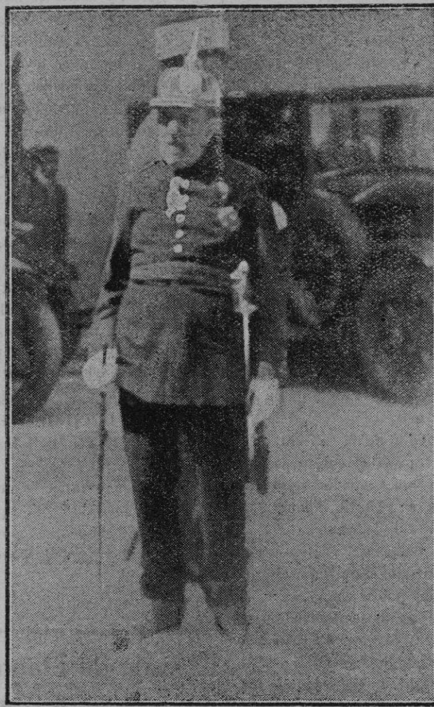
El Capitán General Emo. Sr. D. Valeriano Weyler y Nicolau, que falleció ayer, en Madrid. (Fotografía obtenida durante las fiestas conmemorativas de la Conquista de Mallorca, al salir nuestro ilustre paisano de la Capitanía General).