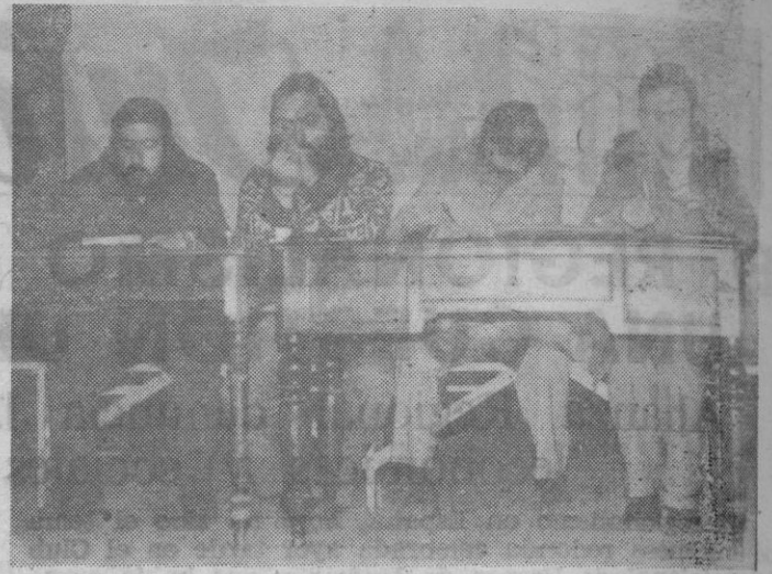
Los cuatro trabajadores que han intervenido en las primeras negociaciones del convenio colectivo explican a sus compañeros los resultados alcanzados hasta ahora.

El presidente, entre otros asuntos, informó a los reuni-