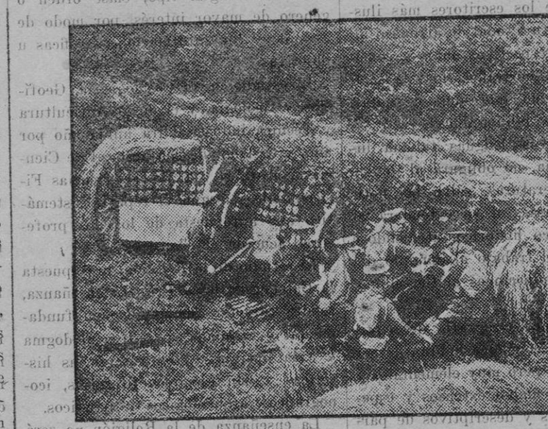
Prácticas de artillería durante la guerra.

El filial de El Terreno y demás Capillas y Conventos encerrados en la mencionada Parroquia. Dia 3, por la mañana, a las 8.30 se celebró la misa para cumplir los mismos oficios pastorales, consagrando la tarde de ese mismo día a la filial de Capdella y parroquia de Andreix, villa en que S. E. R. tiene el domicilio de su familia durante la noche.