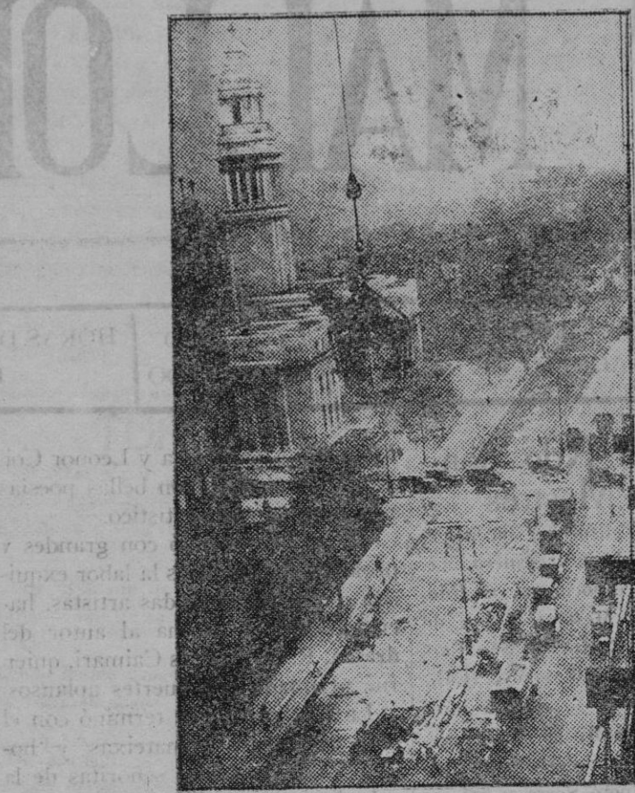
Londres. — Un director y un fotógrafo cinematográficos durante una toma de vistas para la que emplearon la grúa de un edificio en construcción en Baker Street.

Entre las instituciones más típicas del derecho catalán figura la de las capitulaciones matrimoniales. La familia ca-