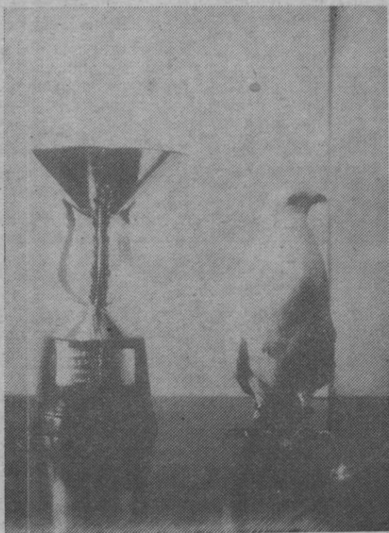
"Lord". Palomo blanco con su primer trofeo conquistado

Con ruego de publicación recibimos la siguiente nota: