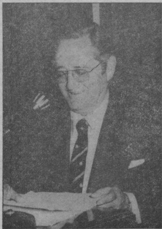
«Hace falta una Comisaría o Dirección General del Consumo, no dependiente del Ministerio de Comercio, donde los intereses, llamados a entenderse, podrían, en cambio, resultar intereses encontrados»

Insistiendo en el tema, y a preguntas de si podría ocurrir que se dejara de poner a la venta el aceite de girasol, para que las amas de casa no tuvieran otra opción que adquirir el de oliva, mucho más caro, el señor García-Pablos manifestó que sí podría suceder. El grupo de pro-