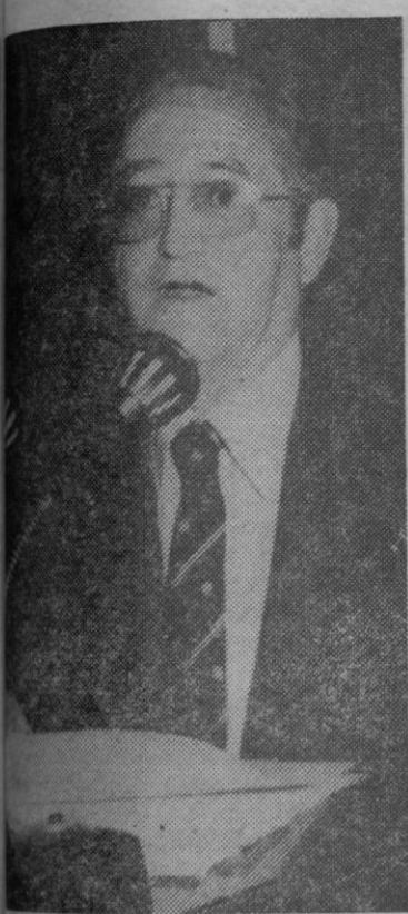
sin Tribunales de Mercado, sin costo alguno para el denunciante, ¿quién va a denunciar, si le va a costar más llevar el caso a los tribunales?"

En relación con el tema del cierre de la Universidad de Valladolid, «ABC» informa hoy que el ministro de Educación y Ciencia, señor Martínez Esteruelas, ha tratado, trata y tratará con los procuradores y el Ayuntamiento de la ciudad del tema Valladolid. El presidente del Gobierno, don Carlos Arias, recibirá seguramente a la comisión municipal vallisoletana que le ha pedido audiencia por segunda vez. Pero, según el diario madrileño, los esperanzadores rumores de que la solución de la Universidad cerrada comenzaría con una convocatoria de exámenes en junio, según firmes y poderosos indicios, van a quedarse en eso. Sólo rumores y buena voluntad. No habrá exámenes, al menos, hasta que pase el verano. Así parece que se ha dispuesto, con afán de ejemplaridad. Aunque cabe esperar una próxima declaración sobre el caso.