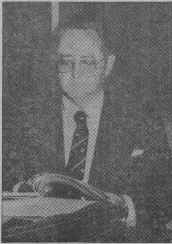
«Los problemas del consumo empiezan a no ser sólo problemas de alimentación, sino de todo cuanto se consume y de todos cuantos consumen, porque todos consumimos algo»