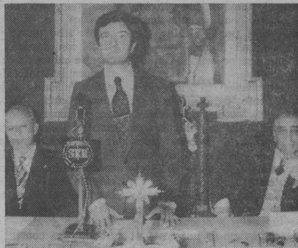
Intervención del gobernador civil

Por último pidió al gobernador civil que en su nombre y en el de Segovia, de la que ya es su representante, hiciera llegar su adhesión y lealtad al Jefe del Estado, al Príncipe de España y al presidente del Gobierno.