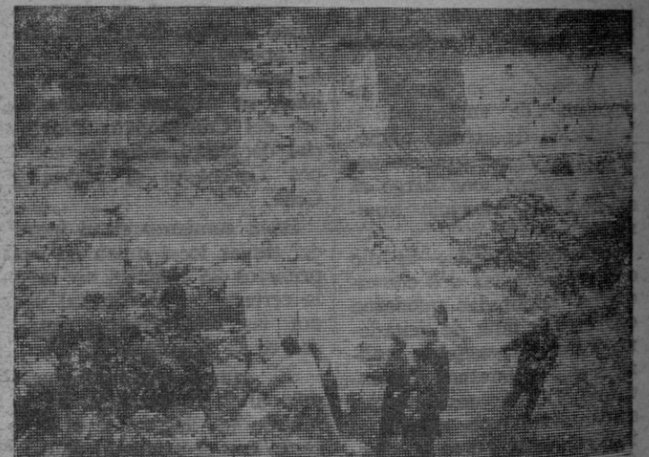
El escudo es rescatado de entre las ruinas