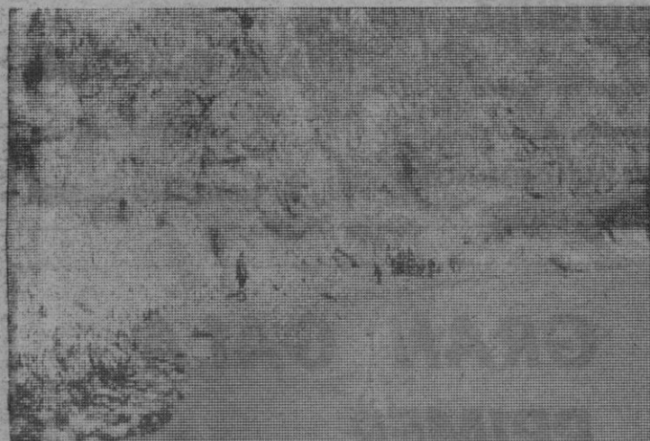
Los miembros de la operación rescate al lado del río y junto a la pared de gran altura que tuvieron que salvar elevando el escudo, de gran peso