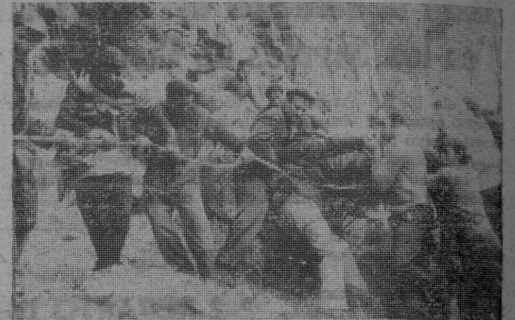
Poco a poco, la mole de piedra va siendo llevada hasta la cumbre