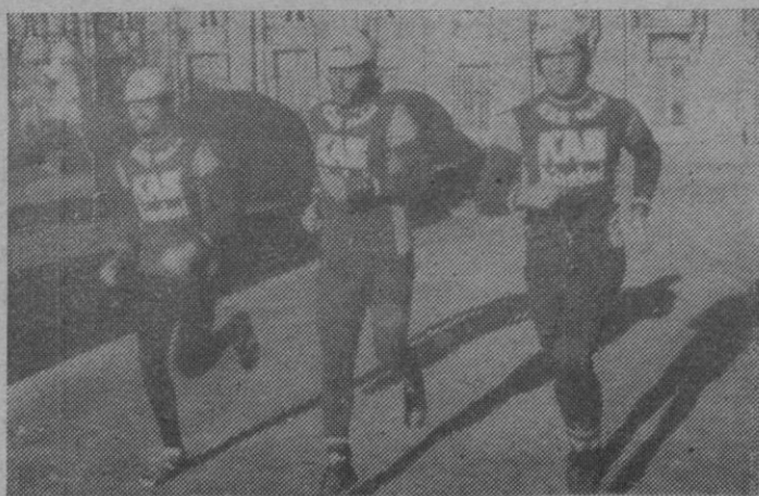
A la carrera, muchachos...