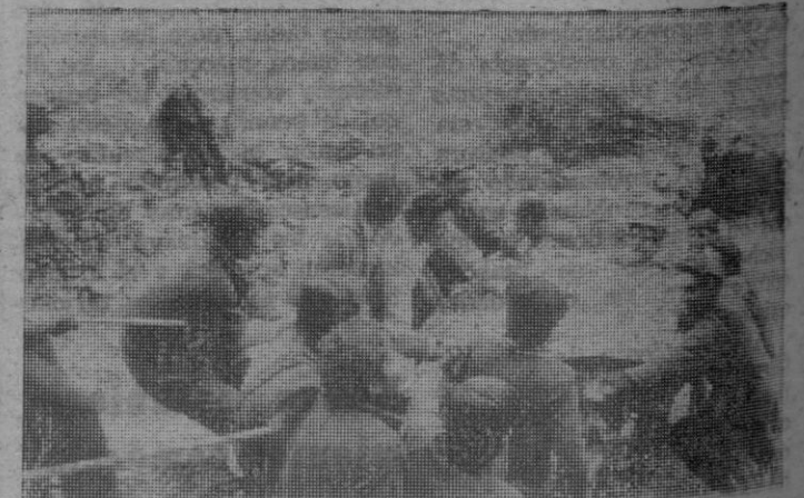
Muchas horas les costó poder rescatar la pieza arqueológica