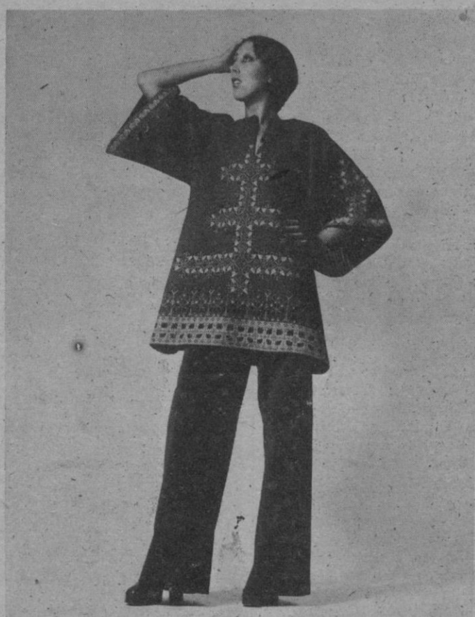
Chilabas de grueso tejido labrado, con estampaciones de estilos exóticos. Pueden utilizarse en periodo de gestación (Modelos Palmas)