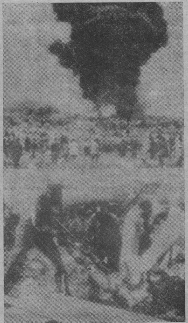
58 son los muertos en la catástrofe del «Jumbo» en Nairobi. Hay 98 supervivientes. En las fotografías, el momento de la explosión y recogida de víctimas del siniestro