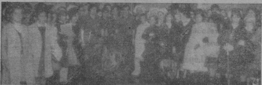
Estas dos fotografías, de Antonio, corresponden al acto de ofrenda de coronas ante el monumento a los caídos, que se celebró en la mañana de ayer dentro de la conmemoración de la muerte de José Antonio Primo de Rivera, fundador de Falange Española.