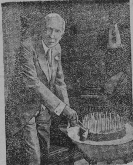
El multimillonario Mr. Rockefeller, que hace días cumplió 91 años, y a quien regalaron un pastel adornado con 91 bujías.

re excitar el celo de los Celadores de Vías y Obras del interior para que denuncien a los propietarios que efectúen obras sin permiso.