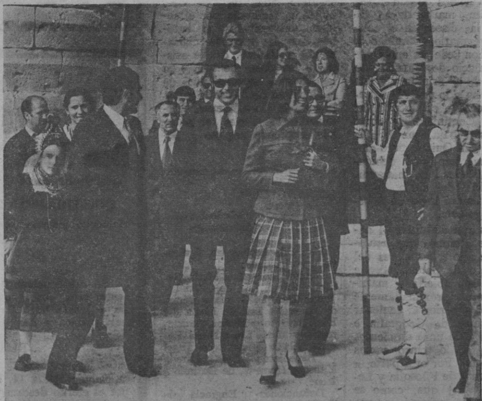
Los duques de Cádiz tras visitar el castillo de Pedraza