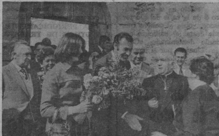
En Turégano, una vecina, espontáneamente, ofreció a la duquesa de Cádiz un ramo de flores.