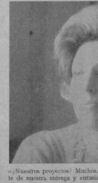
«Nuestros proyectos? Muchos, pero su ejecución dependerá, aparte de nuestra entrega y entusiasmo, de las ayudas que recibamos»