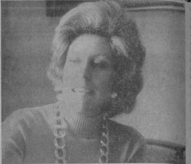
«Nuestra asociación pretende la defensa de los intereses del ama de casa, su formación y la ayuda mutua entre ellas»