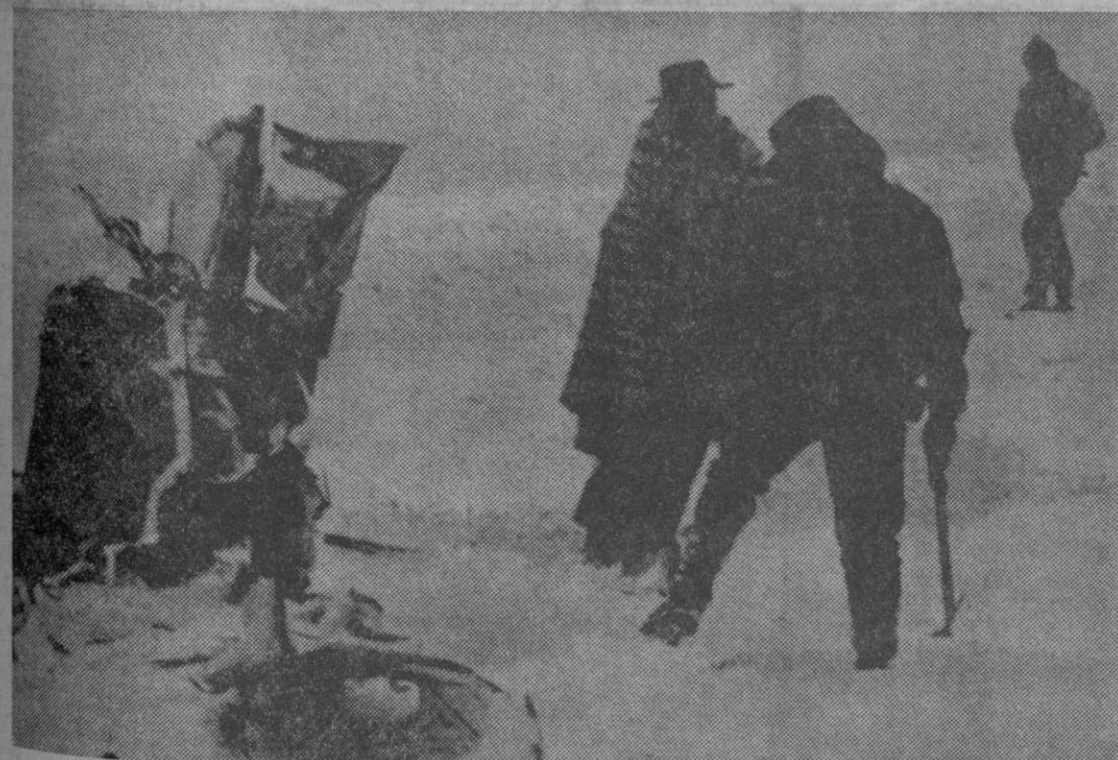
Nieve y mal tiempo dificultaron los trabajos de rescate de las víctimas del avión de la base de Matacán estrellado en la sierra de Gredos, suceso en el que perdieron la vida un capitán y dos alumnos de la Escuela de Polimotores.—(Información en página 8)