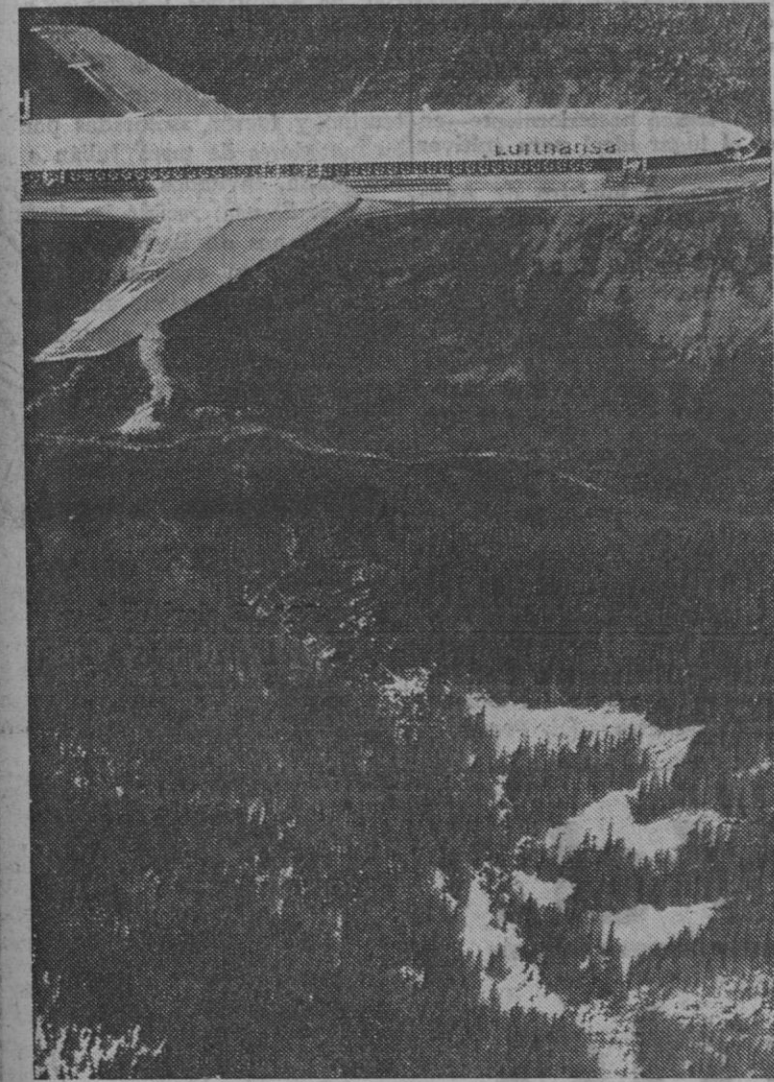
En un avión como este sobrevolarán la región centro los niños españoles