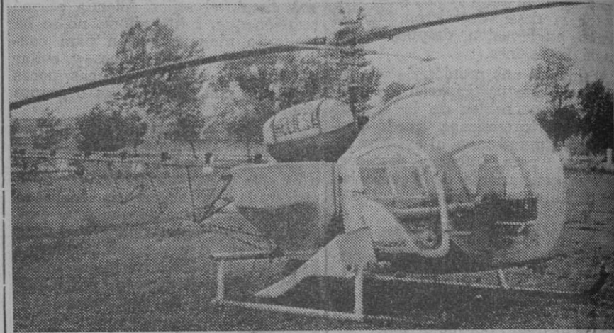
Este es el helicóptero que se utiliza en los trabajos

Como es sabido, para hoy y mañana estaban anunciadas las operaciones de fumigación para el tratamiento de las alamedas y olmedas segovianas, que iban a efectuar equipos especializados de la firma «Helicas», desde un helicóptero, juntamente con personal del Ministerio de Agricultura. Los correspondientes trabajos han sido programados por el Servicio de Defensa contra Plagas e Inspección Fitopatología de la Dirección General de la Producción Agraria.