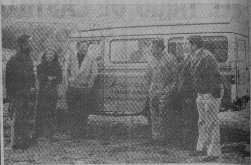
En la fotografía superior—obtenida en el «puesto de mando» de La Piedad—los técnicos en los trabajos de fumigación explican a nuestro compañero las causas que han motivado la suspensión momentánea de aquéllas

Debido a las adversas condiciones climatológicas