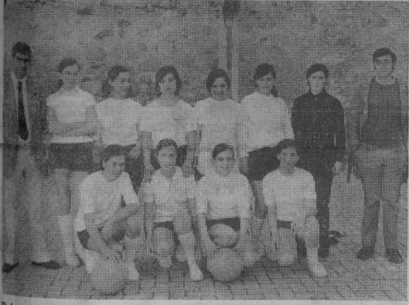
Baloncesto femenino: Equipo de la Obra Atlético Recreativo (OAR)