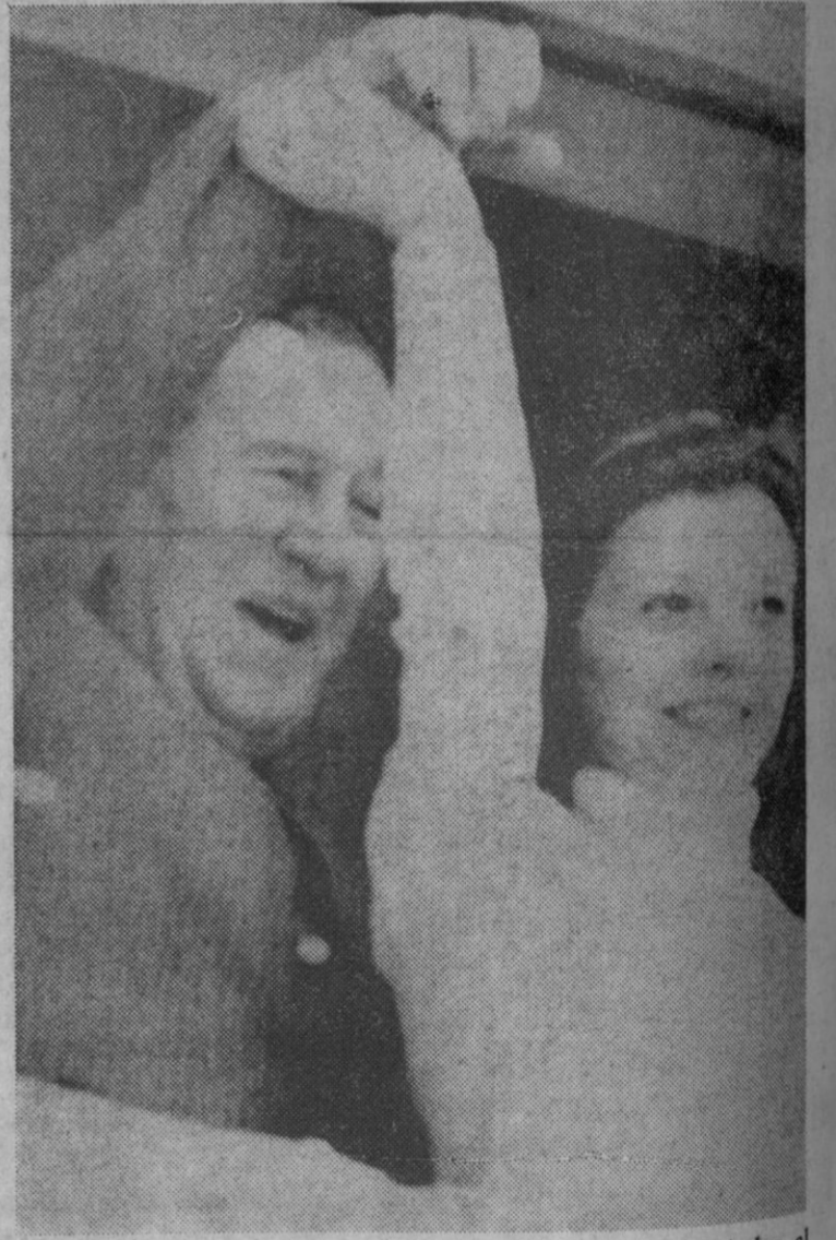
Isabel Perón sostiene el brazo de su esposo, mientras saludan al pueblo que fue a saludarles a su residencia del suburbio Vicente López de esta capital.

El afeitado, como se informó en su día, será objeto de subasta, y los ingresos que se obtengan se destinarán a un asilo de la caridad. A los asistentes a la ceremonia se les entregará un bigote a la entrada, donará un equipo arbitral que traerá la tarjeta roja a quien acceda con este aditamento capilar.—Afe.