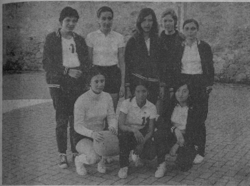
Baloncesto femenino: Equipo del Calasancio A.