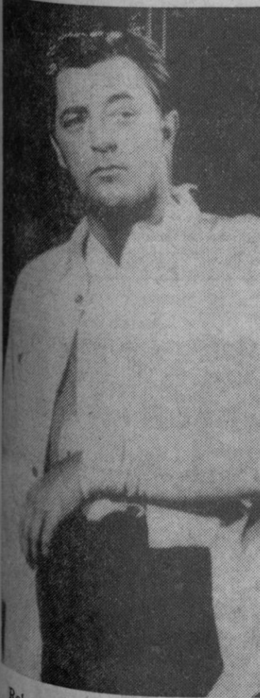
Robert Mitchum, cuyas películas se van a cobrar actualidad al ser presentadas por TVE, en un nuevo video dedicado al famoso actor.