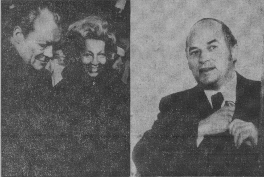
Bonn.—Los dos líderes de los partidos, el hoy canciller Brandt con su esposa, y el líder de la oposición, Rainer Barzel, depositando su voto en las elecciones parlamentarias del domingo. Después en el recuento vino el triunfo de Brandt y de los socialdemócratas.

Madrid, 20.—Quince personas han resultado muertas y cinco gravemente heridas en los catorce accidentes ocurridos el pasado fin de semana en las carreteras españolas, según datos provisionales de la Jefatura Central de Tráfico.—Cifra.