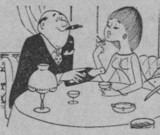
—Cuando se tiene un jefe como usted se siente marchar de vacaciones.

SU RELOJ... ROAMER Auténtico sumergible BAYON Cervantes, 1. - Teléfono 411647