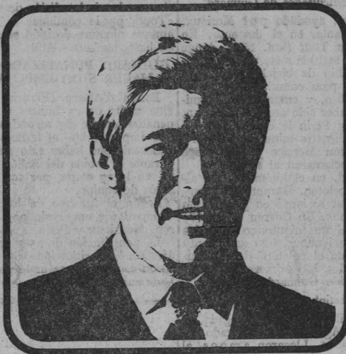
SEGUNDO: Dependiente de comercio, de 25 años de edad, percibiendo por todos los conceptos computables para cotización en el mes de Julio 12.000 pts. y 12.000 pts. por la paga extraordinaria del 18 de Julio. Días computables por paga extraordinaria: 30 días. Base de tarifa aplicable, Grupo 5 = 5.130 pts.

JULIO BASE TARIFADA: 5.130 BASE COMPLEMENTARIA INDIVIDUAL: (1) 5.130 BASE ACCIDENTES DE TRABAJO: 12.000