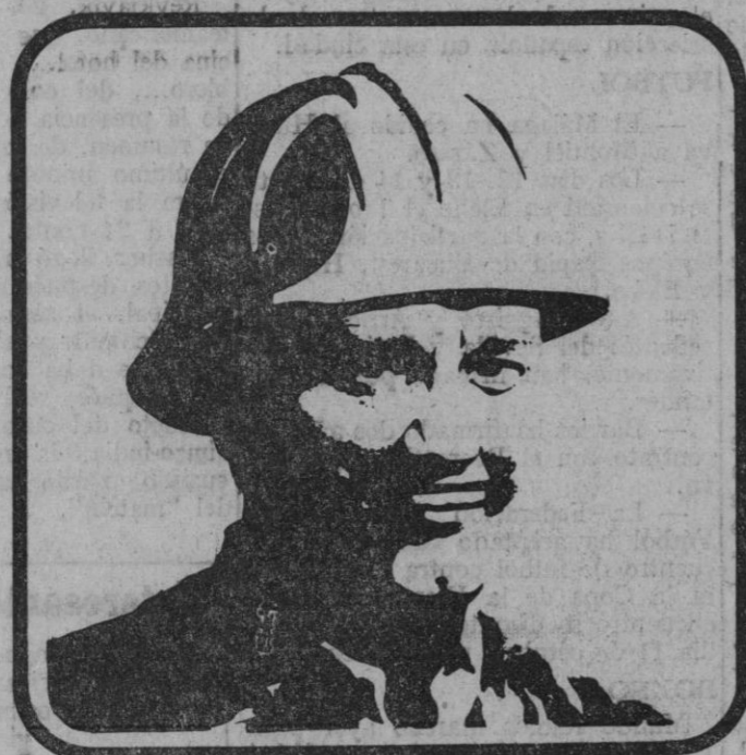
PRIMERO: Oficial de 1ª de Siderometalurgia, percibiendo por todos los conceptos computables para cotización en el mes de Julio 10.850 pts. y 3.360 pts. por la paga extraordinaria del 18 de Julio. Días computables por paga extraordinaria: 10 días. Base tarifada aplicable, Grupo 8, = 168 pts. diarias.

La forma de practicar la nueva cotización no es difícil Empresario: colaboramos con Vd. en hacerlo correctamente