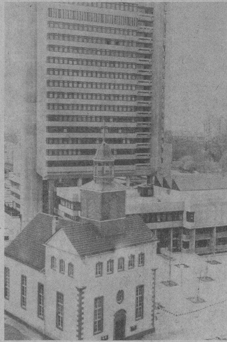
Offenbach.—Aunque Offenbach está ya unida a Francfort, sin embargo se mantiene independiente, como ciudad, con 122.000 habitantes y una historia casi milenaria. Lo que nunca tuvo fue casa consistorial propia. Ahora ha construido la que nos muestra la foto, con 72 metros de altura y 17 pisos, en la que se alojan todas las secciones administrativas. Al lado una antigua y pequeña iglesia.