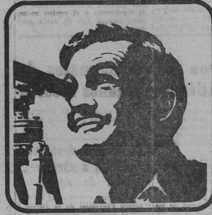
TERCERO: Ingeniero de Siderometalurgia, percibiendo por todos los conceptos computables para cotización en el mes de Julio 25.000 pts. y 15.000 pts. por la paga extraordinaria del 18 de Julio. Días computables por paga extraordinaria: 10 días. Base de tarifa aplicable, Grupo 1.º = 8.700 pts.

(1) En el periodo 1/7/72 a 31/3/73 esta base complementaria individual no puede ser superior al importe de la base tarifada.