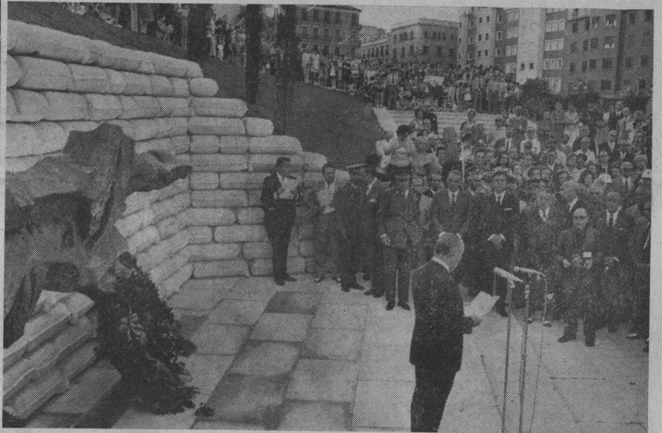
Madrid.—Los ministros de Gobernación, Ejército y Hacienda; alcalde de Madrid, gobernador civil y demás autoridades han inaugurado en la tarde de ayer el monumento a los Caídos del Cuartel de la Montaña. En la foto el señor Arias Navarro dirigiendo unas palabras.—(Foto Europa Press)

Poco después del mediodía continuaban los trabajos para rescatar de los coches siniestrados los últimos cuerpos que aún quedaban por extraer. En estos trabajos participan fuerzas del Ejército, de la Cruz Roja, Guardia Civil, Policía Armada y numerosos campesinos y vecinos de El Cuervo que espontáneamente se ofrecieron a colaborar en estas operaciones.—Cifra.