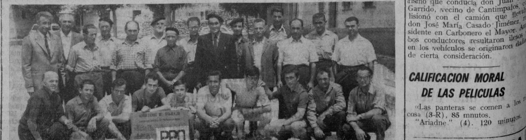
Torreiglesias.—Se clausuró ayer en esta localidad el curso de Promoción Profesional Obrera, en la especialidad de ganadería, que se ha celebrado durante tres meses. En el curso del sencillo acto de clausura que tuvo lugar, los alumnos recibieron de manos de las autoridades locales el título acreditativo del aprovechamiento demostrado a lo largo de las clases impartidas.