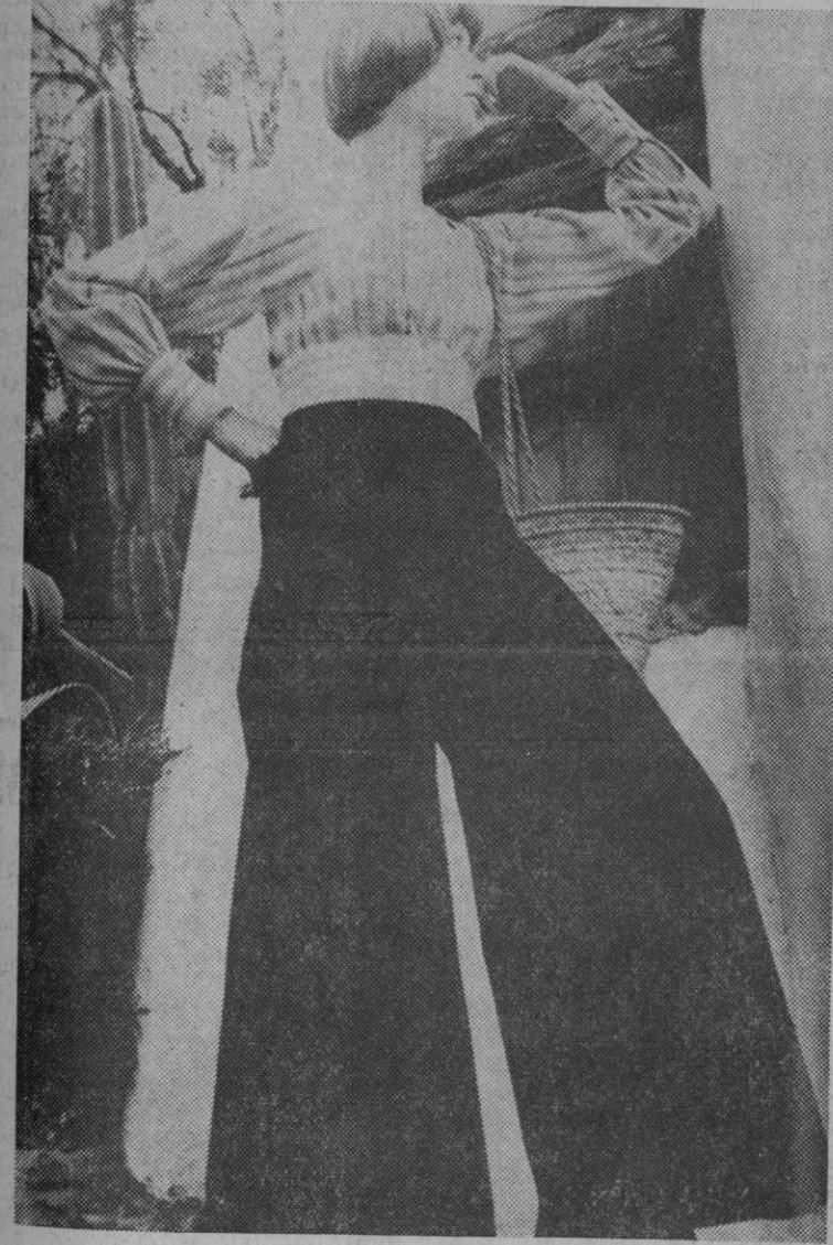
Como ya es sabido, ha nacido en Ibiza la moda «ad-lib», de «ad libitum», en latín («como usted quiera», en castellano). Se caracteriza por un estilo cómodo, con ausencia total de rigidez en la línea, utilizando preferentemente el algodón y el cuero, bordados a mano y ganchillo. Ahí tienen nuestras lectoras ese modelo, inspirado, como todos, en las más entrañables tradiciones de la isla.

La época de las «gafas únicas», ha quedado tan atrás, en nuestros días, como la del «vestido único».