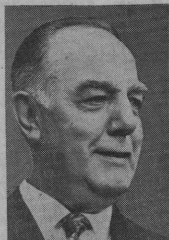
Baltasar J. Vorster, primer ministro de África del Sur, cuyo régimen está provocando una agitación creciente en dicho país