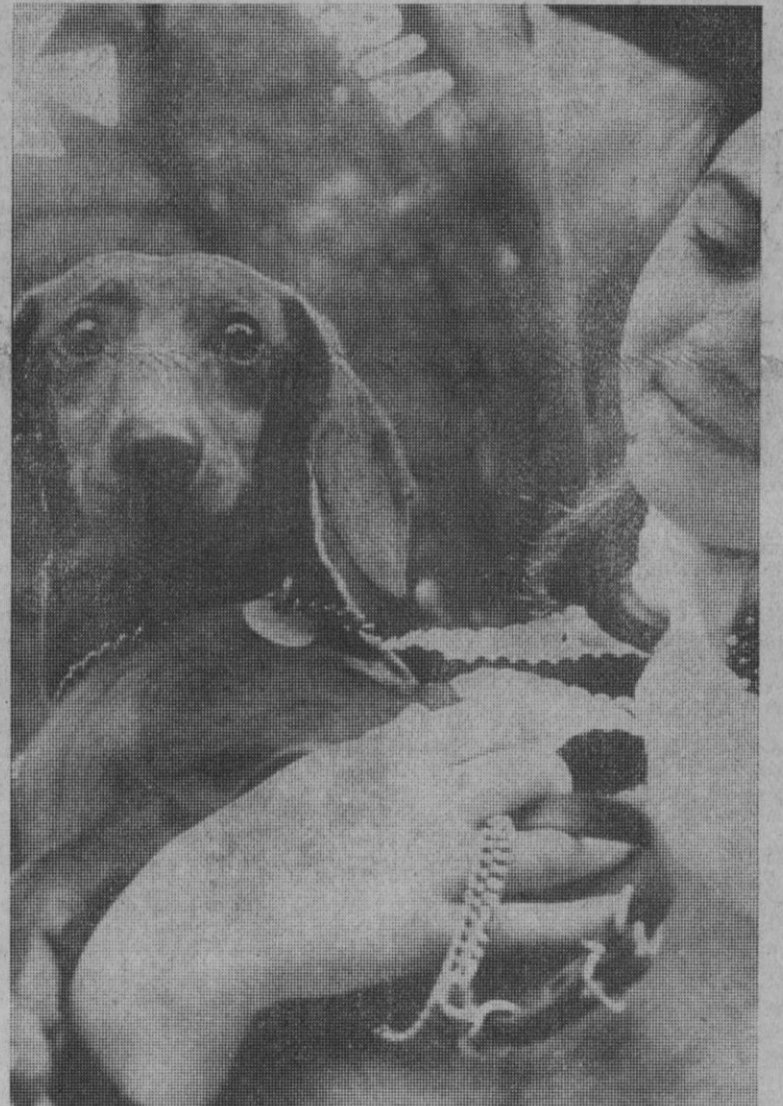
Los perros salchicha alemanes tienen ahora su gran ocasión. Allí, en Alemania, han sido elegidos como mascota oficial de los próximos juegos olímpicos. Su imagen adorna ya pañuelos, jarros de cerveza y, por supuesto, las camisetas de los deportistas alemanes. Se trata de una clase de perros extrovertidos, alegres e incansables compañeros de los niños.