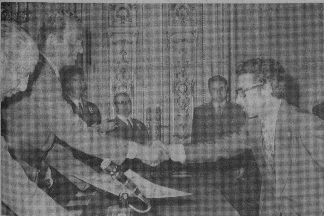
Madrid.—El Príncipe de España, don Juan Carlos, entrega el premio «Ejército 1971» de periodismo gráfico al redactor de la Agencia Europa Press, don José Cuadrado, en acto celebrado en el salón de Embajadores del Ministerio y al que asistieron los ministros de Educación y Ciencia y secretario general del Movimiento.—(Telefoto Europa Press)

El cardenal vicario termina su invitación a los fieles pidiendo unión en torno a Pedro, que es tanto como unión en torno a la Iglesia.—Efe.