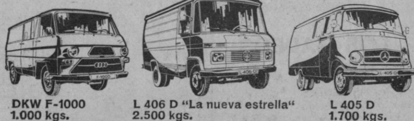
DKW F-1000 1.000 kgs. L 406 D "La nueva estrella" 2.500 kgs. L 405 D 1.700 kgs.