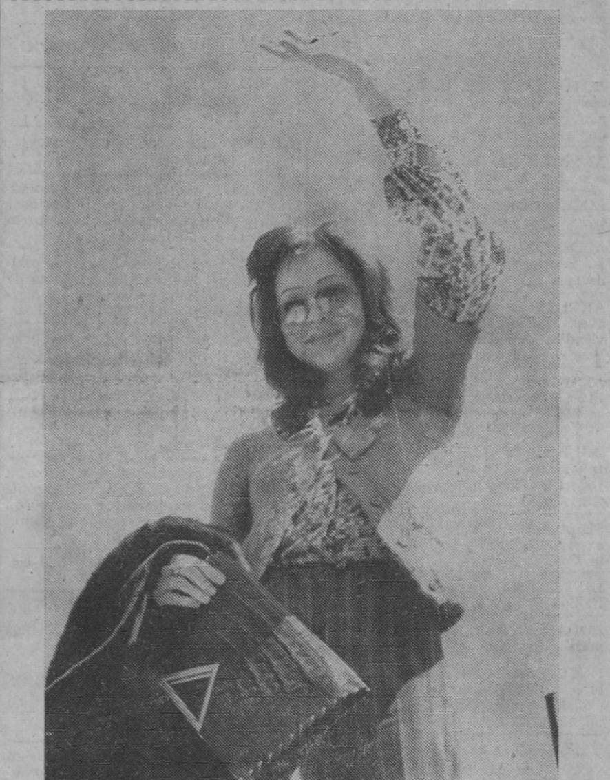
Madrid.—Vicky Leandros, la reciente ganadora del Festival de Eurovisión con la canción «Après toi» celebrado en Edimburgo, a su llegada al aeropuerto de Madrid-Barajas procedente de Londres.

Centenares de piezas de artillería y ciento veintiséis tanques y blindados anfibios, todos ellos de fabricación soviética, son las principales pérdidas materiales de las fuerzas invasoras, según estas fuentes.—Efe.