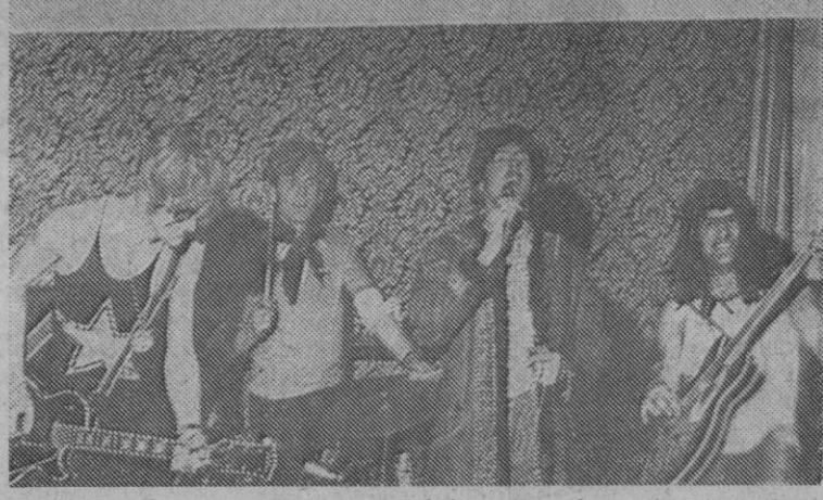
Londres.—Cuatro policemen británicos han formado el conjunto musical llamado The Fuzz. Aparte del costoso material han tenido que proveerse de pelucas «ye-yés». El estilo de los «polis» y su indumentaria en escena ha merecido la aprobación de los expertos en la música «pop».