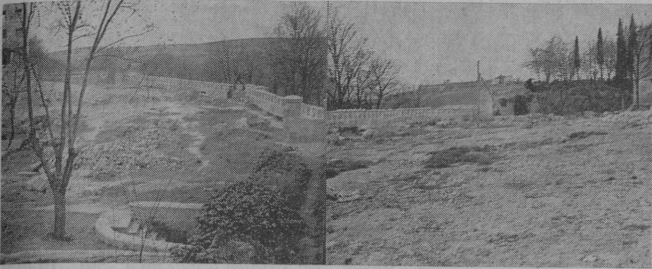
Perspectiva de la gran extensión de terreno sobre la que se proyecta crear un jardín.

Orden de busca y captura del autor o autores del robo de 61 pesetas en el Instituto de Cuéllar