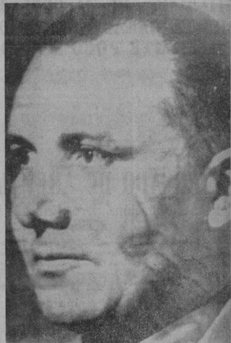
Londres.—Fotografía de la última guerra mundial en la que aparecen Martín Borman, declarado criminal de guerra en Nuremberg y a quien la policía boliviana cree haber detenido, al realizar el arresto de un hombre de nacionalidad alemana con el nombre de Johann Ehrmann.

Pompidou permaneció en todo momento impasible y sin pronunciar palabra ante el inesperado recibimiento.—Efe.