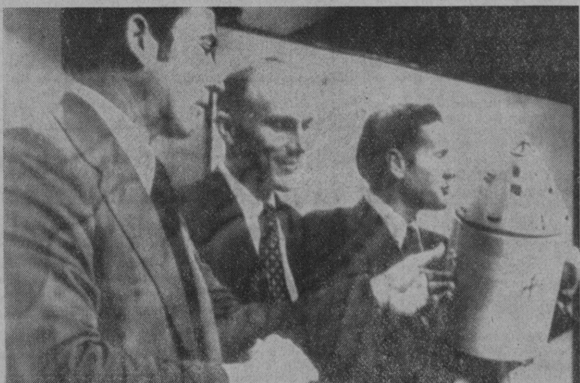
Centro Espacial de Houston.—Los astronautas del «Apolo 16», John Young, Thomas Mattingly Charles Duke responden a las preguntas de los informadores sobre los objetivos de la misión espacial «Apolo 16». El lanzamiento de la nave está programado para el próximo día 16 de abril.

El primer abastecedor es Francia, con unas exportaciones durante el año 1971 por valor de 3.774 millones de pesetas y el tercero Italia, con 1.173 millones de pesetas.—Cifra.