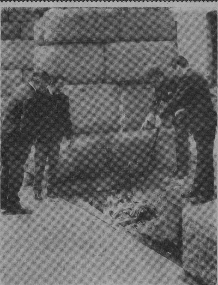
Según es sabido, con motivo de las obras de consolidación que se llevan a cabo en el acueducto han aparecido algunos objetos, como vasijas, piletas, etc.

Tras unas negociaciones entre los atracadores y la Policía, ésta se comprometió a cesar durante veinte minutos la persecución a condición de que pusieran en libertad a los dos rehenes. Estos fueron liberados a las ocho de la noche cerca del pueblo de Neukirchen. La Policía emprendió la captura de los tres atracadores tres minutos después de que los rehenes fueran liberados. Varias unidades de la Policía Montada ayudadas por perros, continuaban la búsqueda de los secuestradores en los bosques próximos a la población de Rohrbach (Sarre). Efe.