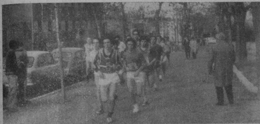
Un momento de la prueba de cross.

En la mañana de ayer se celebró, por los alrededores de la Casa Sindical, el I Trofeo Navidad de Educación y Descanso de campo a través, organizado por dicha Obra Sindical, con la colaboración técnica de la Federación Provincial de Atletismo. Participaron diez equipos: Cinco de Valladolid, uno de Salamanca, uno de Madrid, uno de Zaragoza y dos de Segovia.