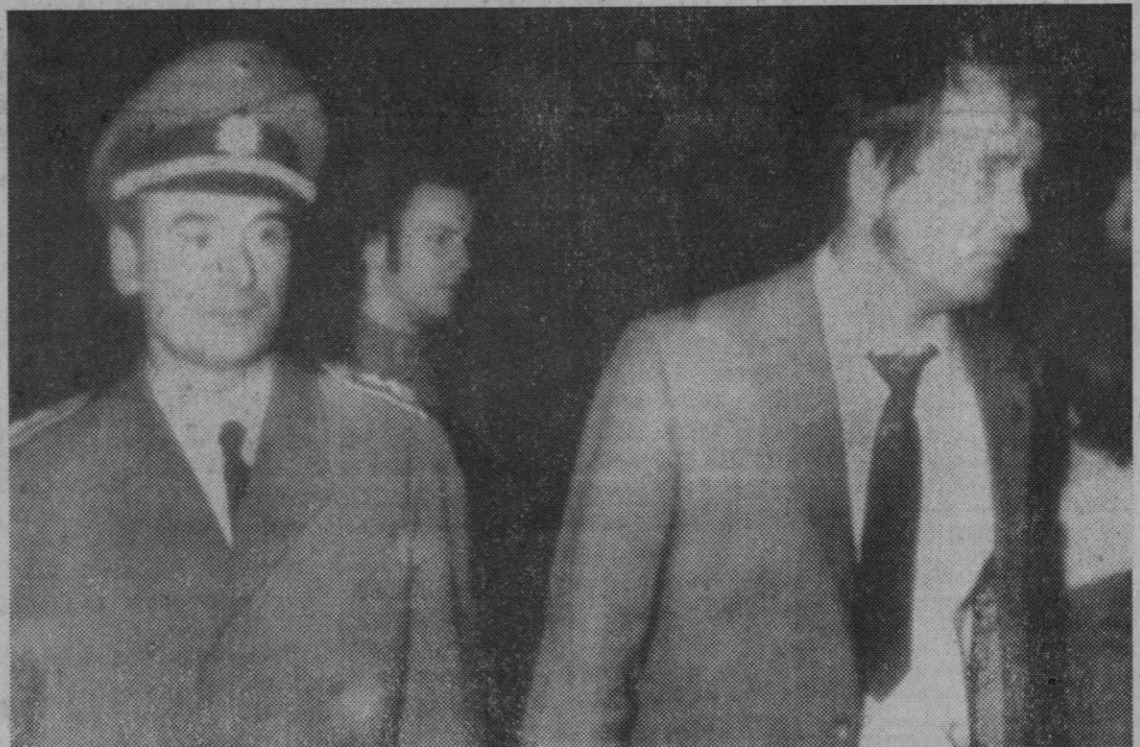
Dos policías que fueron tomados como rehenes por la banda de asaltadores que robaron el Banco de Colonia, fueron puestos en libertad en Homburg-Saar cerca de Saarbrücken.

No se descarta la posibilidad de que los tres atacadores—dos franceses y un austriaco— hayan conseguido burlar el cerco y escapar