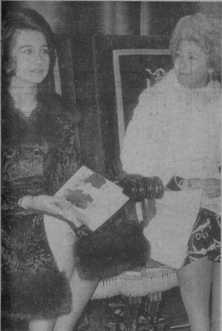
Madrid.—En el Club «Pueblo» la Reina Federica de Grecia, ha presentado su libro «Memorias de la Reina Federica». Al acto asistieron la Princesa Sofía, los ministros de Información y Turismo y Relaciones Sindicales y diversas personalidades.

Moscú, 28.—La Unión Soviética ha anunciado hoy el lanzamiento acontecido ayer, del satélite «Cosmos 470», que continúa la serie de los «Sputniks» iniciada hace nueve años.