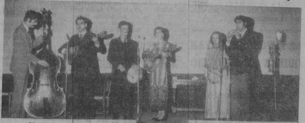
Un momento de la actuación de «Nuevo Mester de Juglaría».