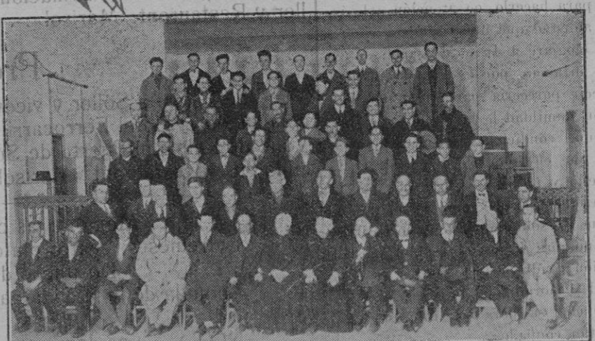
Grupo de ejercitantes que tomaron parte en la última tanda de Ejercicios espirituales organizados por el Patronato Obrero.

En el "Círculo Mallorquín" El poeta don Guillermo Colom efectuará una lectura de poesías originales, esta tarde, a las siete, en el salón de fiestas del "Círculo Mallorquín". La asistencia al acto será pública.