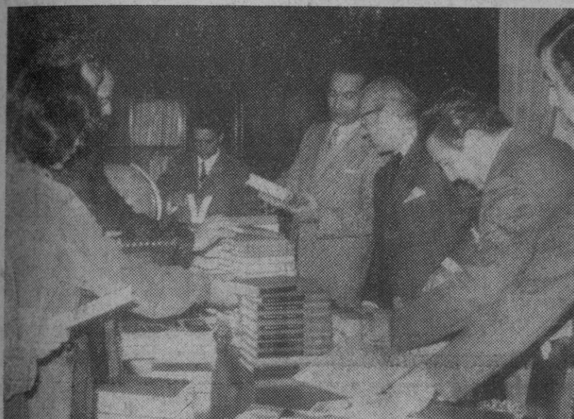
Según damos cuenta en la sección de información local, esta mañana, en el transcurso de un acto celebrado en el Gobierno Civil, se han entregado lotes de libros y otro material a varios teleclubs de la provincia. La fotografía recoge un momento de dicho acto.—(Foto Antonio).

dentos Mobutu, de Zaire, y Ahmadu Ahidjo, de Camerún, realizarán una segunda visita a Israel y Egipto a finales del presente mes. El presidente de la Organización de Unidad Africana, Moktar Uld Daddah, ha manifestado que la misión de paz hará «nuevas sugerencias, que espera sean aceptadas por las partes implicadas». —Efe-Reuter.