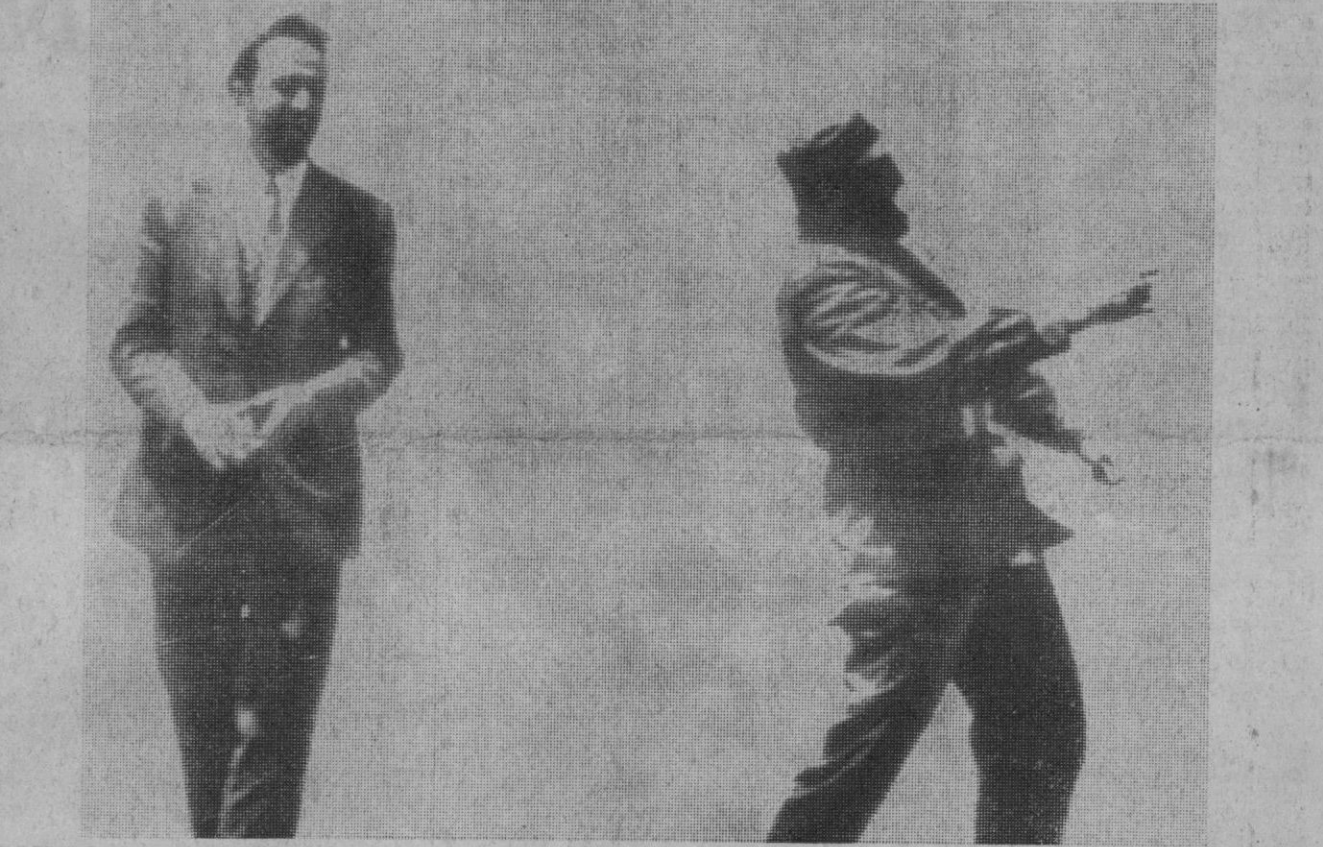
Antofagata (Chile).—El primer ministro cubano, Fidel Castro, arroja una piedra en el desierto, a más de nueve millas de Antofagata. Junto a él Jaime Suárez Bastida, ministro secretario del Gobierno chileno. Castro está recorriendo Chile en su visita oficial al país.—(Telefoto Europa Press)

Madrid, 13.—El Servicio Meteorológico Nacional prevé para las próximas 24 horas, cielo muy nuboso en Galicia, Cantábrico y Alto Ebro, con chubascos. Nuboso en la meseta superior, Levante, Cataluña y Baleares. Chubascos de nieve en los sistemas montañosos. Poco nuboso en el resto del país. Tendencia a subir ligeramente las temperaturas. Temperaturas extremas en España: máxima de 17 grados en Almería, Huelva y Sevilla. Mínima de 5 grados bajo cero en Ciudad Real.