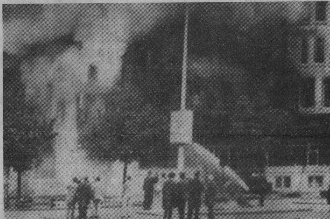
Eindhoven (Holanda).—Una vista del gigantesco incendio declarado en el hotel «Silveren See-paert» de esta ciudad. De acuerdo con los primeros informes varias personas han resultado muertas y otras llevadas al hospital con múltiples heridas.