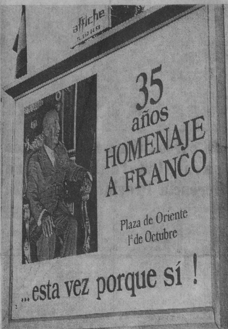
Madrid.—Manana, día 1, se celebrará el homenaje nacional a Franco. Toda España ha respondido unánimemente a dicho homenaje. Carteles anuncian en las calles de la capital la celebración del 35 aniversario de la «Paz de Franco».

La misión militar soviética destacada en Francfort de Main está integrada por 36 miembros. Otro grupo de 20 ciudadanos soviéticos trabaja en las oficinas de «Intouris» de Berlín Occidental.—Efe.