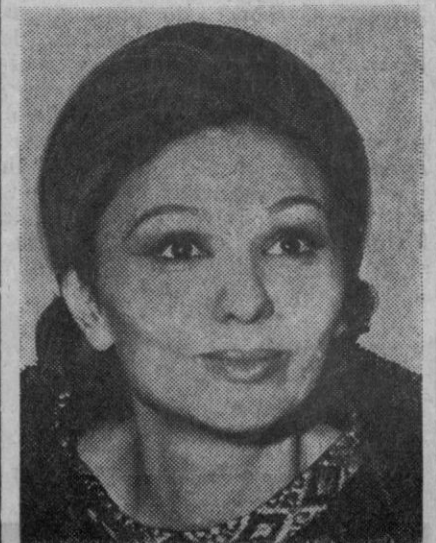
Farah Diba, emperatriz de Persia, que participa con todo entusiasmo en los preparativos de las fiestas que se celebrarán con ocasión del 2.500 aniversario de su país