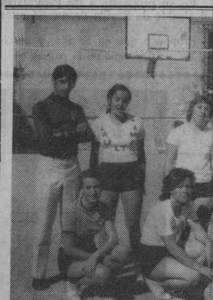
En el campo de deportes de Sección Femenina se ha jugado el primer partido femenino de voleibol. Jugaron los equipos del Zodiaco y Medina, que aparecen en esta fotografía

El C. P. Imperio OJE comunica que todo joven interesado en la práctica del atletismo puede hacer su inscripción en el domicilio social del club calle Cervante, 22, 3.º, derecha, pues la sección de atletismo va a ampliarse considerablemente, contando ya con cuatro entrenadores (unos de primera categoría nacional) para la temporada 1971-72.