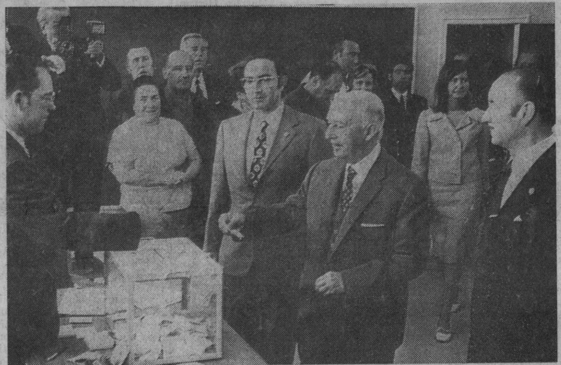
El Pardo.—Su Excelencia el Jefe del Estado, uniéndose a la mayoría de los españoles, en el momento de depositar su voto en la jornada electoral para procuradores familiares. Toda España eligió sus representantes para la próxima legislatura de Cortes.