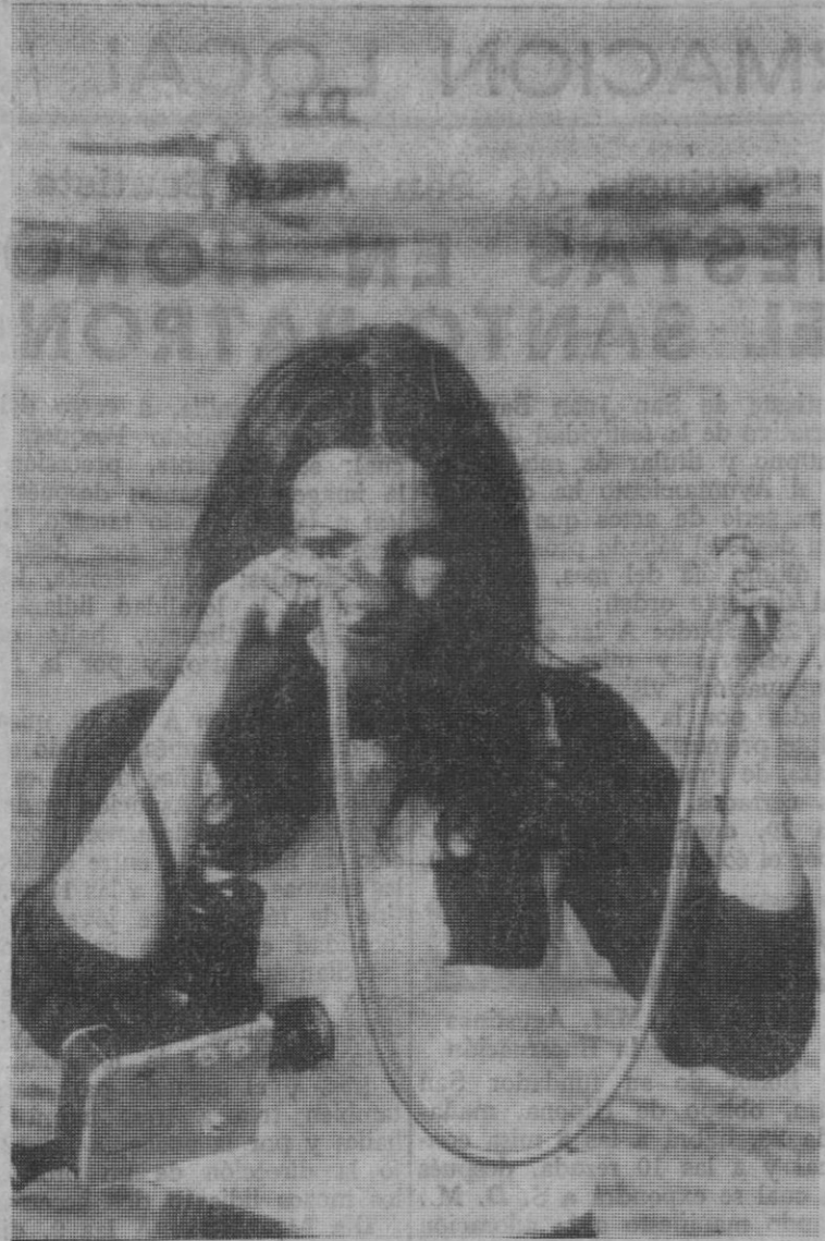
Maguncia.—Sin volver la cabeza, la joven señorita reproducida en nuestra foto, puede ver lo que está sucediendo detrás de su espalda. El conductor flexible de imágenes posibilita la mirada «alrededor de la esquina». Mediante el sistema de lentes en el tubo flexible es posible descubrir objetos ocultos y fijarlos en fotografías o películas.—(Foto DaD).