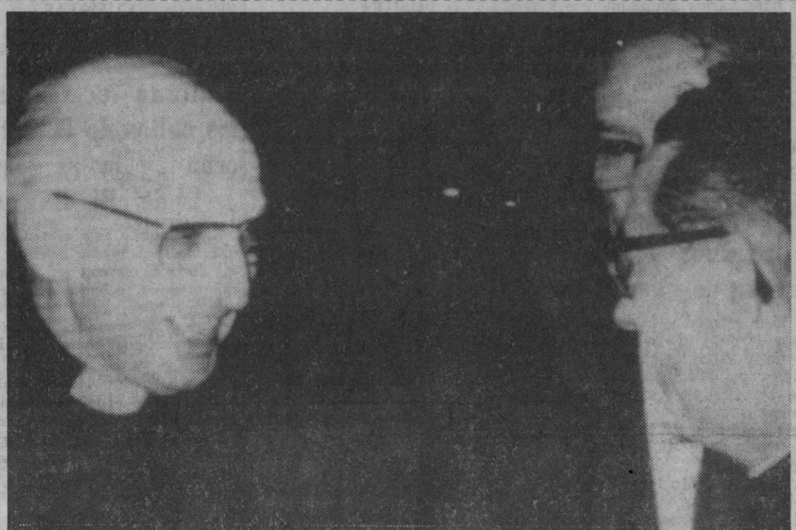
Lieja (Bélgica).—El padre Pedro Arrupe, izquierda, superior general de los jesuitas, conversa con un sacerdote no identificado, poco antes de comenzar la reunión internacional de alumnos de escuelas jesuitas. El padre Arrupe ha salido hoy para Moscú.

Madrid, 27.—«Es muy posible que después del verano entre en vigor un nuevo horario para el Comercio en poblaciones de más de 25.000 habitantes», dice la revista económica «El Europeo», en su último número. Añade que, «según los ramos, algunos establecimientos abrirán hasta las once de la noche, cerrarían un día entre semana y permanecerán abiertos la mañana del domingo. Según parece—añade seguidamente—, la fórmula, aún en discusión y con importantes intereses sociales, económicos y hasta políticos en contra, puede ser un primer paso para una reforma amplia de los desfasados horarios españoles en relación a otros países europeos».—Cifra.