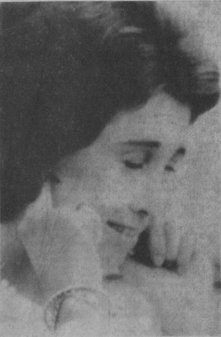
Santander.—«Astillero» acaba de cruzar la meta como vencedora de las regatas. El cañonazo ha sonado... eso, como un cañonazo y la Princesa Sofía, junto al Príncipe Juan Carlos, tapa sus oídos ante el colosal ruido.

A continuación, los Príncipes de España, visitaron Fuen De, al pie de los Picos de Europa, en cuyo parador almorzaron.—Cifra.