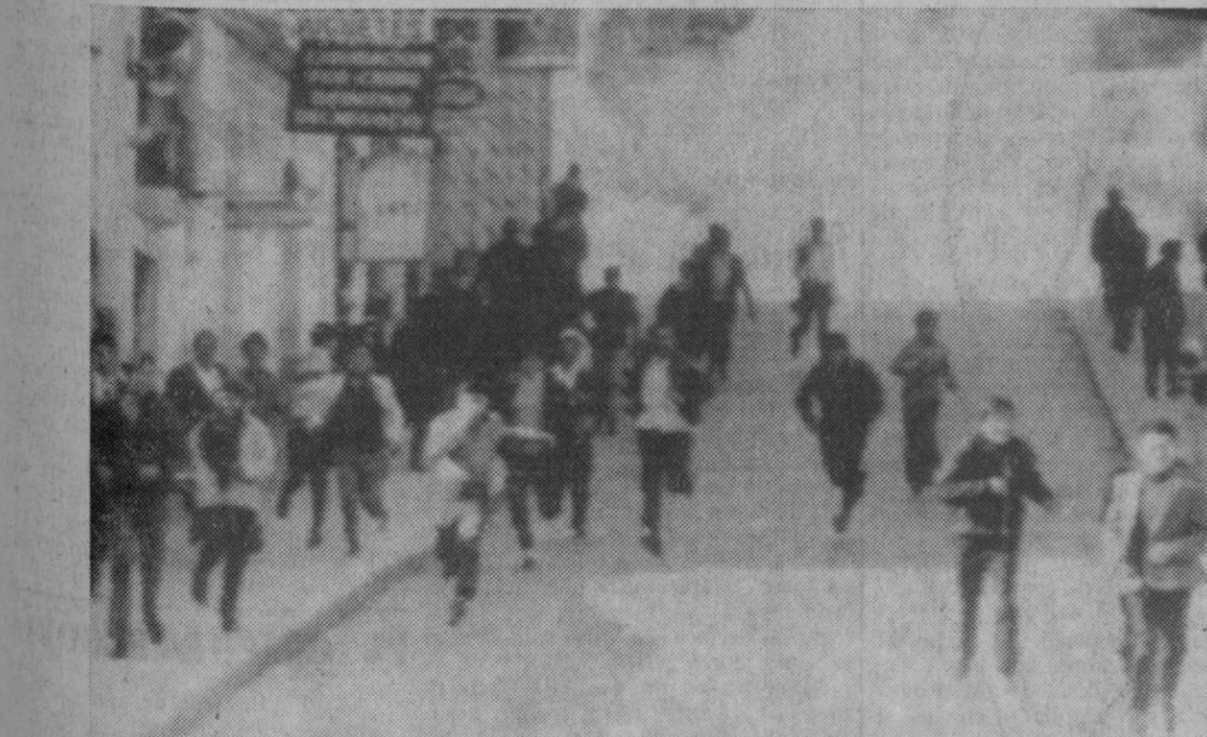
La Paz.—Un grupo de ciudadanos corre por una calle, al hacer explosión la puerta de entrada a un edificio. La puerta fue volada por grupos de mineros que buscaban armas y municiones.

Pamplona, 23.—El ministro de Información y Turismo, Alfredo Sánchez Bella, ha prometido que en el transcurso de las próximas semanas, en fecha aún no determinada, pero lo antes posible, se trasladará a la frontera pirenaica navarra para tomar contacto directo con las realizaciones y proyectos que puede significar la definitiva promoción turística de aquellos importantes y naturales lugares. El señor Sánchez Bella no pudo trasladarse el pasado viernes a conocer los proyectos de la estación de invierno en el Pirineo navarro de Belagua, debido a las malas condiciones atmosféricas.—Cifra.