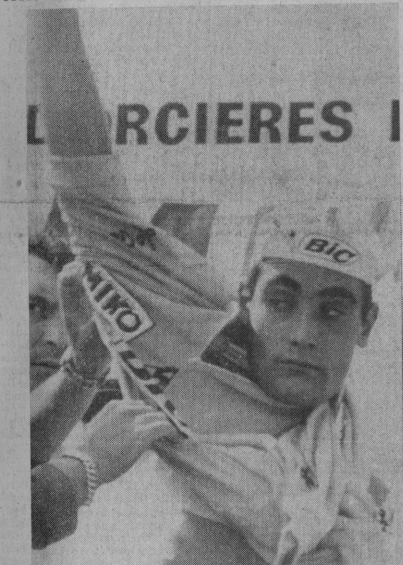
El español Luis Ocaña colocándose el maillot amarillo que le acredita líder del «Tour» de Francia, después de su sensacional triunfo en la etapa disputada entre Grenoble - Orcieres-Merlette.