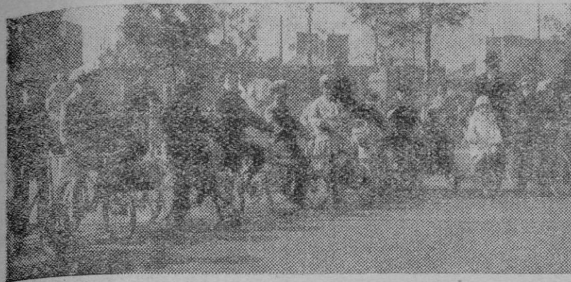
Barcelona.—Pequeños ciclistas que a las horas de sol concurren a la Avenida de Alfonso XIII, en cuyos paseos celebran interesantísimas y graciosas carreras, preparándose para emular a las primeras figuras del pedal.