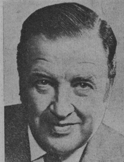
Henri Ford II, el rey del automóvil americano, que piensa abandonar sus investigaciones en Inglaterra a causa de las huelgas en las fábricas Ford en dicho país