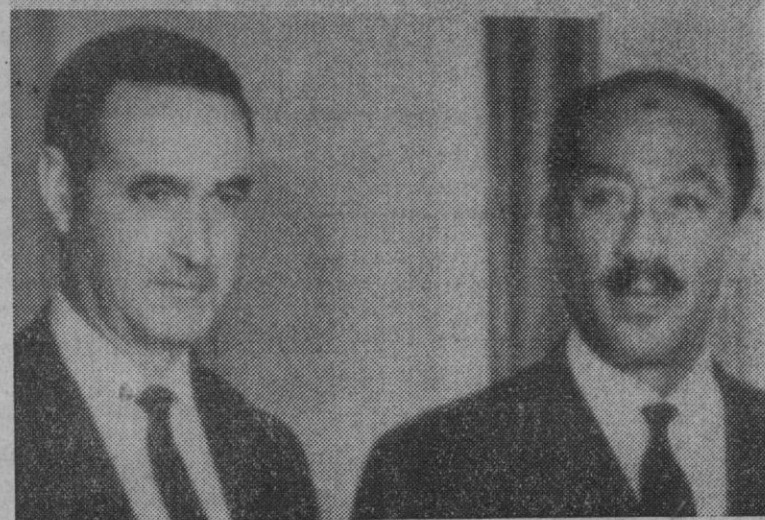
Actividades a escala internacional de los ministros españoles. El de Asuntos Exteriores, señor López Bravo (arriba), firmó un convenio de doble nacionalidad con Argentina, en Buenos Aires. El de Industria, señor López de Letona (abajo) se entrevistó con el presidente de la R. A. U., Anwar El Sadat.

El presidente Allende, que llegó minutos antes de que se iniciara la cena, dialogó cordialmente por espacio de unos veinte minutos con el ministro López Bravo y miembros de su séquito. La inesperada visita del primer mandatario rompe el protocolo y se ha considerado como un gesto de extraordinaria cordialidad del presidente hacia la misión española, que llegó por la mañana a Santiago. Cifra.