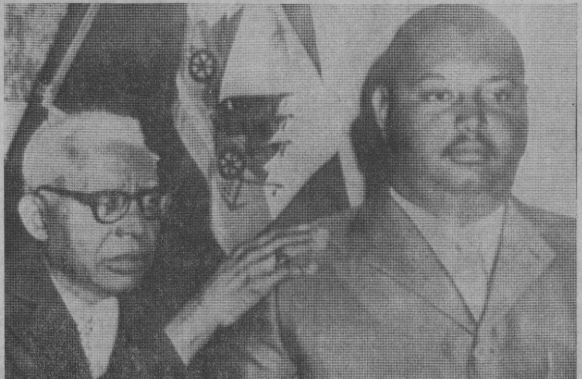
«Papa Doc», el presidente Francois Duvalier, aparece con su mano sobre el hombro de su hijo, Jean Claude, en un gigantesco cartel. El pie del cartel dice: «Aquí está el joven líder que os prometió en mi mensaje del 2 de enero de 1971.» Esta es la copia de uno de los carteles sacados de Haití.

Indice general de la sesión: 105,66 contra 105,29.