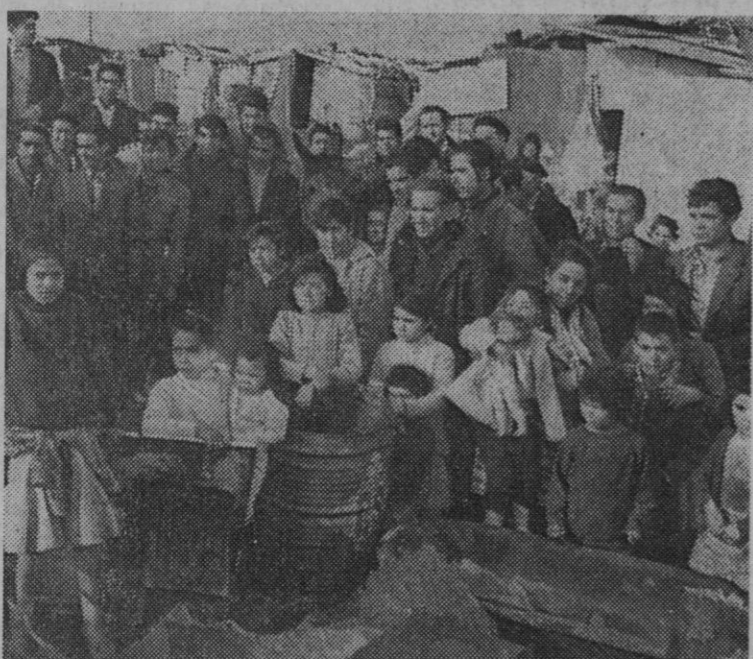
Vitoria.—Un albergue de adaptación social para gitanos ha sido inaugurado con destino a cuarenta y ocho familias residentes desahuciadas en chabolas. Bendijo las instalaciones el obispo de la diócesis. El poblado se encuentra situado en la zona de Vitoria denominada la Lacua.

Sin embargo, los países productores (Continúa en la página 7.)