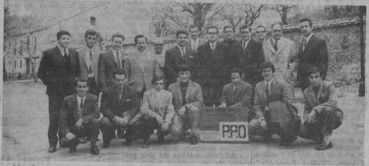
Los delegados de Trabajo, Educación y Ciencia e Industria, junto a los participantes en el curso.

San Ildefonso.—Ha tenido lugar la clausura de un curso de la especialidad de instalador electricista industrial, que P. P. O. ha impartido en concierto con la empresa Cristalería Española, S. A.