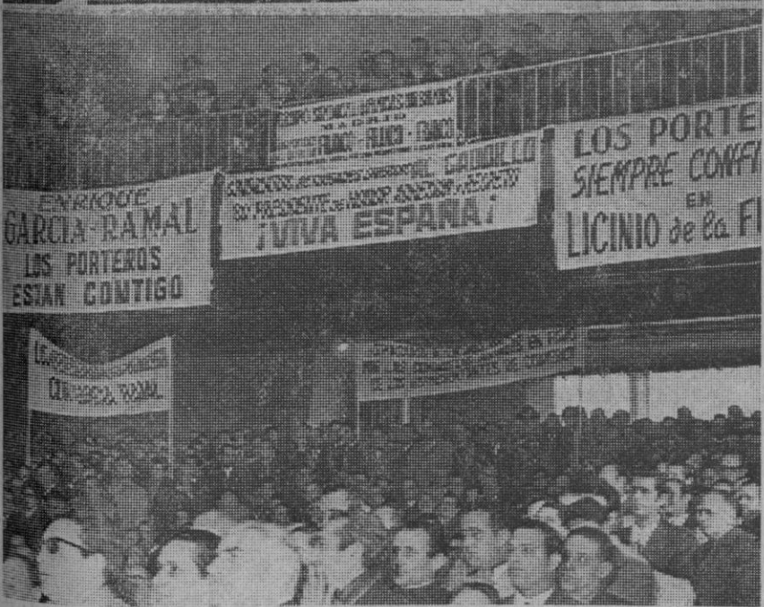
Madrid.—Arriba, momento de la llegada de los ministros de Trabajo, señor De la Fuente, y delegado nacional de Sindicatos, señor García-Ramal, al salón de sesiones de la Casa Sindical, donde se celebró la Asamblea Nacional del Grupo de Porteros de Fincas Urbanas. Abajo, un aspecto de la audiencia que asistió a la lectura del nuevo reglamento del gremio.