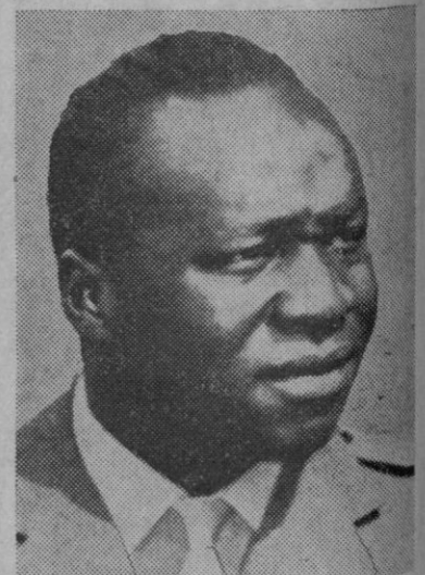
El general Adí Amin, jefe del Estado Mayor del Ejército de Uganda, que se ha hecho cargo del poder y ha formado un Gobierno militar en el país

Trazó la semblanza del homenajeado el ministro de Información y Turismo, señor Sánchez Bella. Don Eduardo Carranza le agradeció sus palabras y leyó una selección de sus versos.