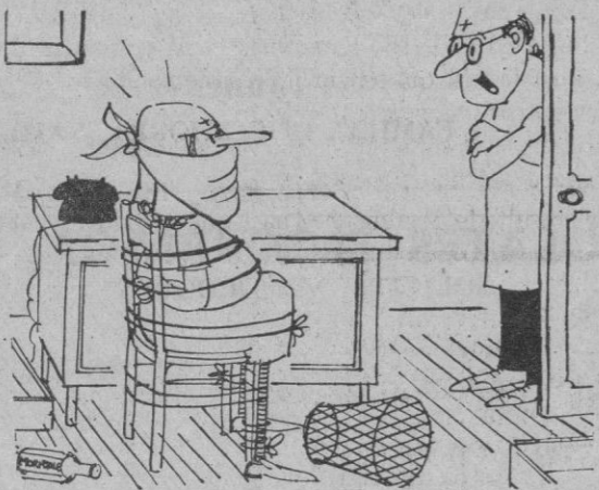
—¿Y pudo resistir toda la mañana sin hablar?

Distribuidor exclusivo: CASA SOLERA Corpus, 7