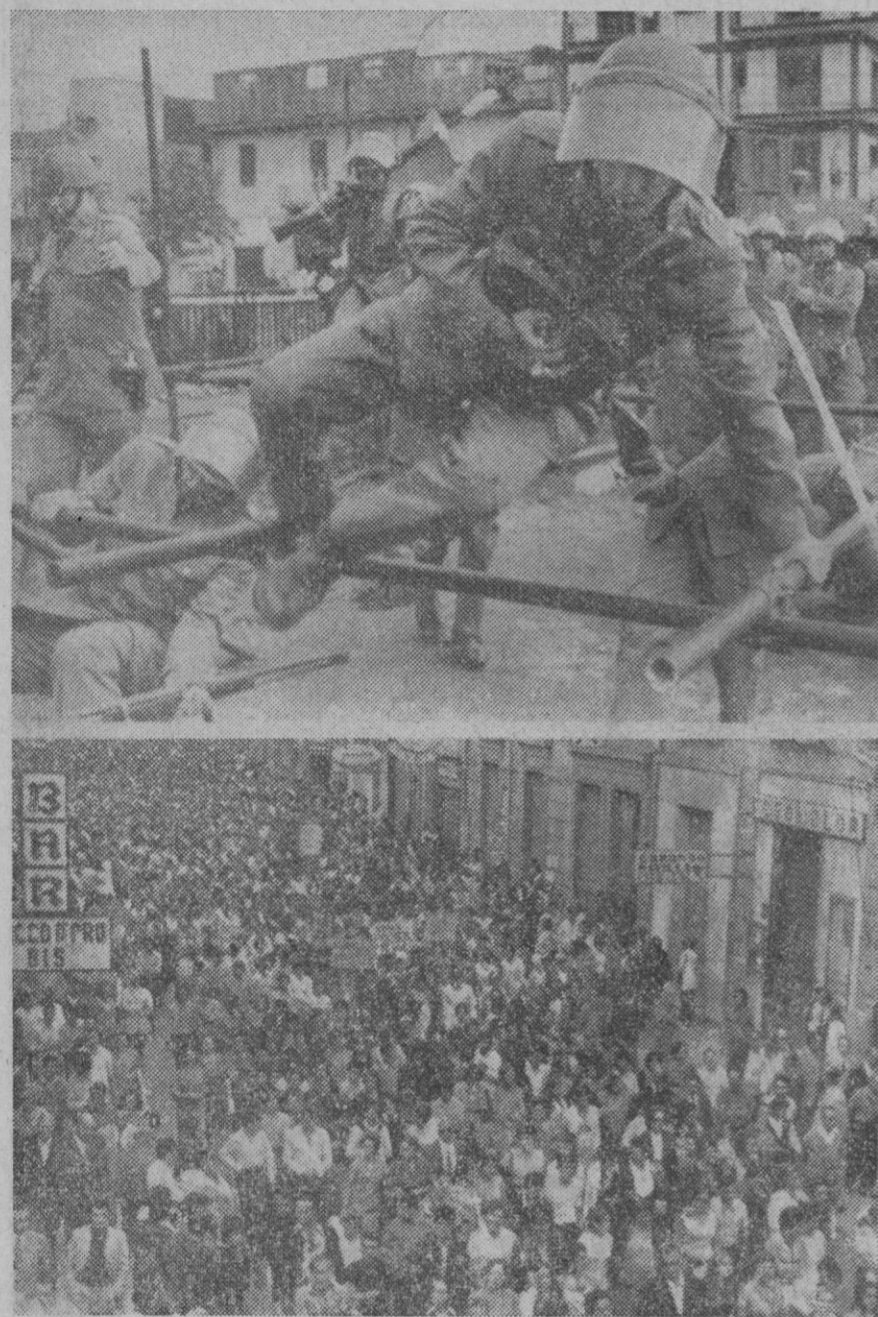
Reggio Calabria.—Arriba: los soldados pasan por entre un entramado de mecanotubo para dirigirse contra un grupo de manifestantes en la ciudad. Abajo: masiva manifestación de los vecinos por las principales calles. Algunos barrios de Reggio Calabria han declarado la "independencia" ante el Gobierno italiano.—(Telefoto AP-Europa Press)

Montreal, 18.—El cadáver ensangrentado del ministro de Trabajo de Quebec, secuestrado por el F. L. Q., ha sido encontrado en el maletero del automóvil utilizado precisamente, hace una semana, para su secuestro.