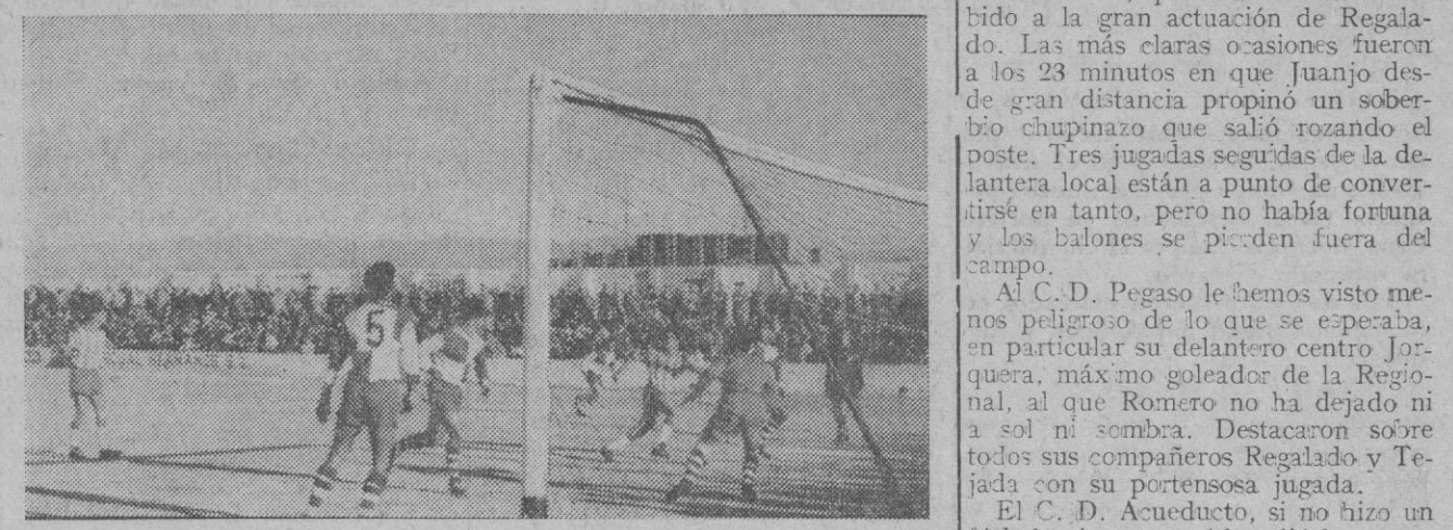
En esta jugada llegó el gol de la victoria del Acueducto.

No se puede decir que el dominio haya caído de una y otra parte y sí, por tanto, que el juego haya estado repartido.