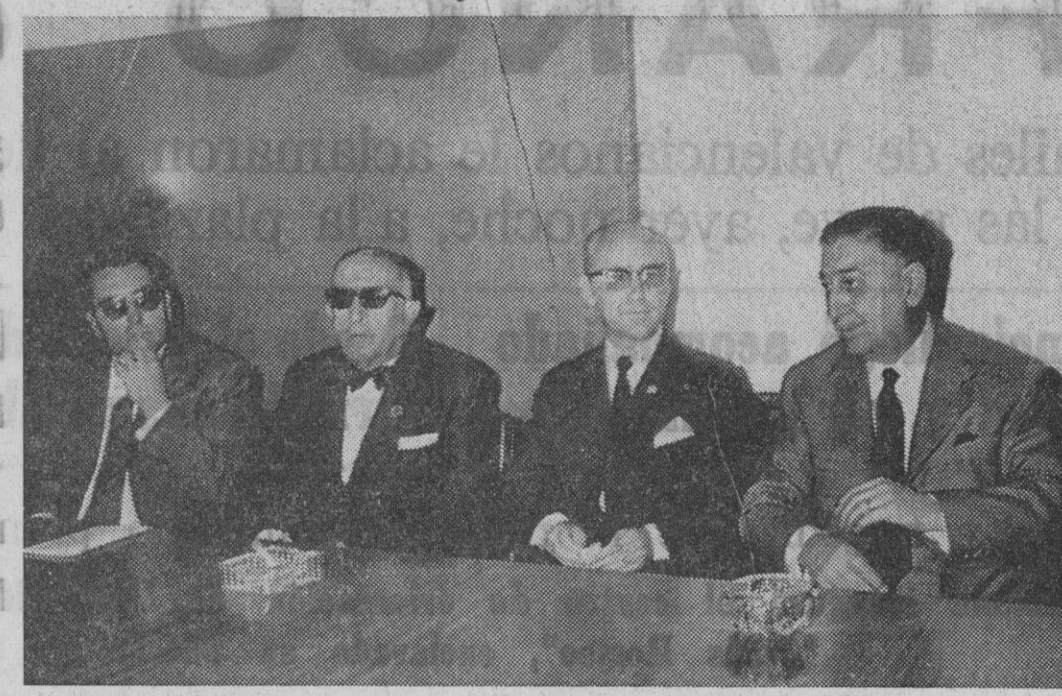
En la presidencia del acto se situaron el gobernador civil, alcalde de la ciudad...