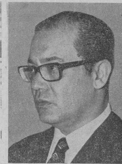
Franco Maria Malfatti, ministro italiano de Correos, que ha sucedido al belga Jean Rey en la presidencia de la Comisión Económica Europea

El finado, que tenía setenta y seis años, tal como dice la canción, fue minero-picador—y se hallaba enfermo de síncosis. El óbito ocurrió en Ribon-Mieres.—Cifra.