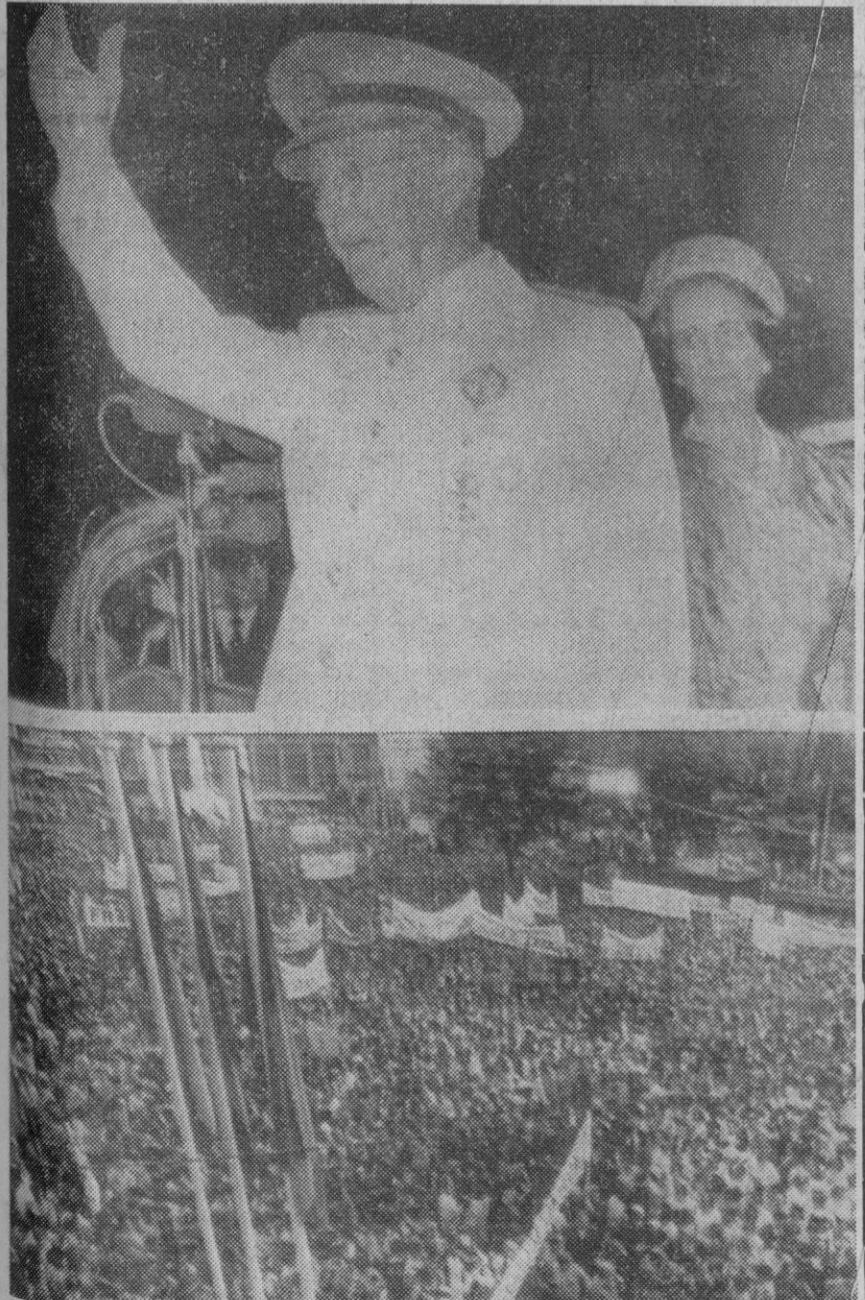
Valencia.—Arriba, el Jefe del Estado, acompañado de su esposa, recibe la aclamación del pueblo valenciano que se congrega en la plaza del Caudillo. Abajo, un aspecto de la citada plaza, abarrotada de público.

Entre ambas partes, se dijo en la sesión de ayer, piensan convocar a más de ochenta testigos, por lo que se calcula que el juicio durará al menos unos seis meses, durante los cuales las doce personas del jurado vivirán aisladas en un hotel de las afueras de la ciudad.—Efe.