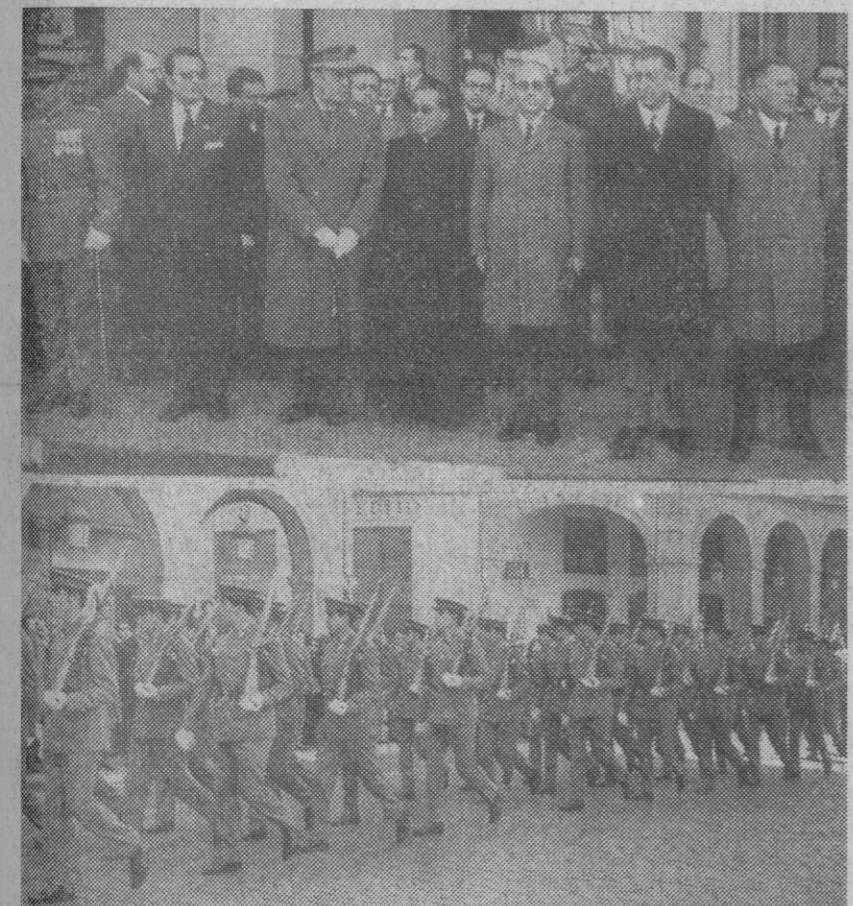
El Cuerpo General de Policía y la Policía Armada han celebrado hoy la festividad del Santo Ángel de la Guarda. Las fotografías han sido obtenidas en la plaza de Franco, al término de una misa oficiada con aquel motivo en la iglesia de San Miguel. En la de arriba, las autoridades segovianas presencian el desfile de las fuerzas de la Policía Armada, que aparecen en la siguiente.

Asistieron a la reunión la totalidad de los representantes de las empresas periodísticas editoras de diarios y Hojas del Lunes de toda España.—Cifra.