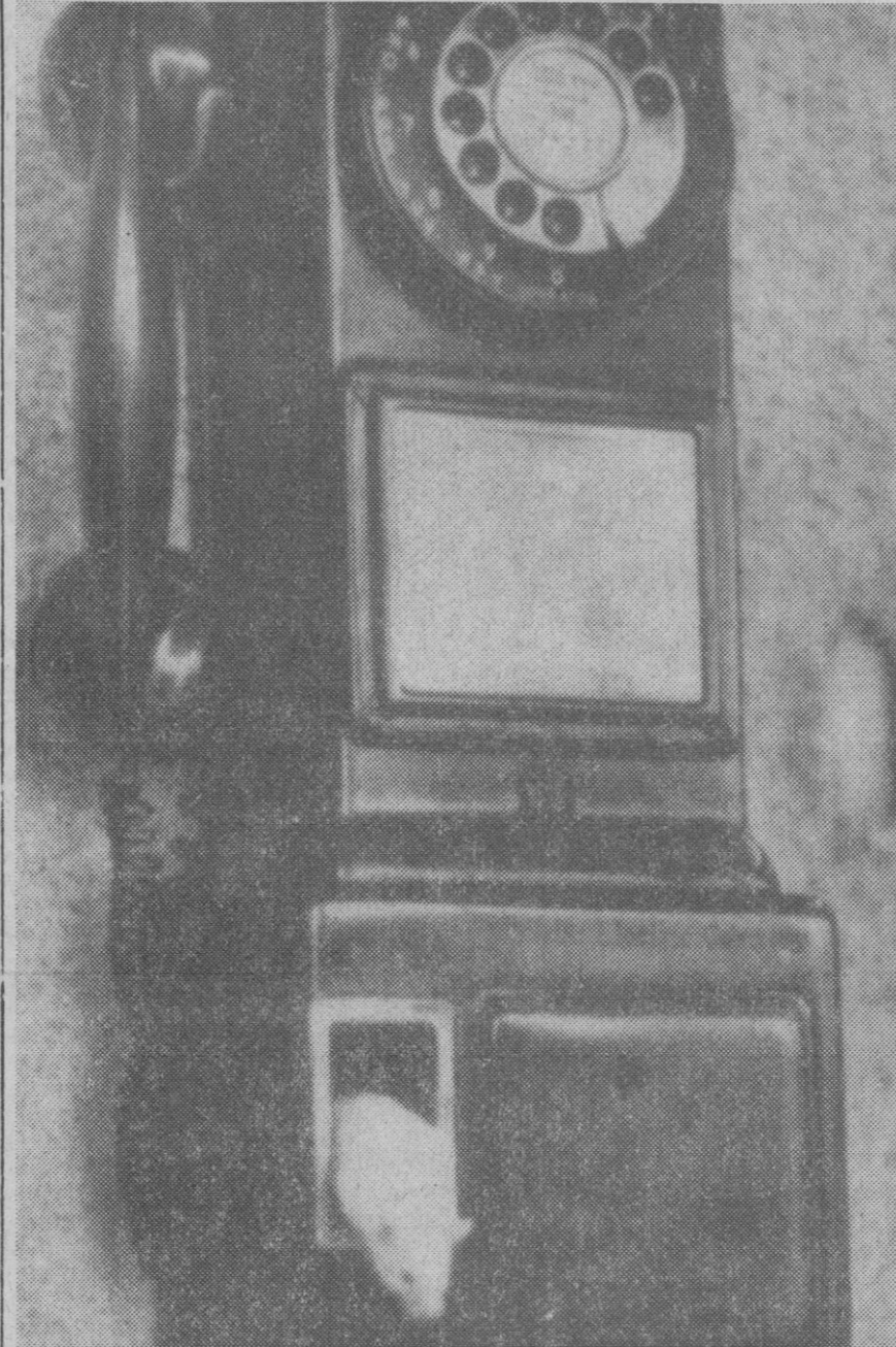
Este ratoncito blanco ha estado viviendo en el depósito de monedas de un teléfono público de una lavandería de Manassas, durante tres días, antes de ser "desahuciado" por los empleados de la compañía telefónica.

El F. B. I. comenzó hoy mismo una investigación.—Efe.