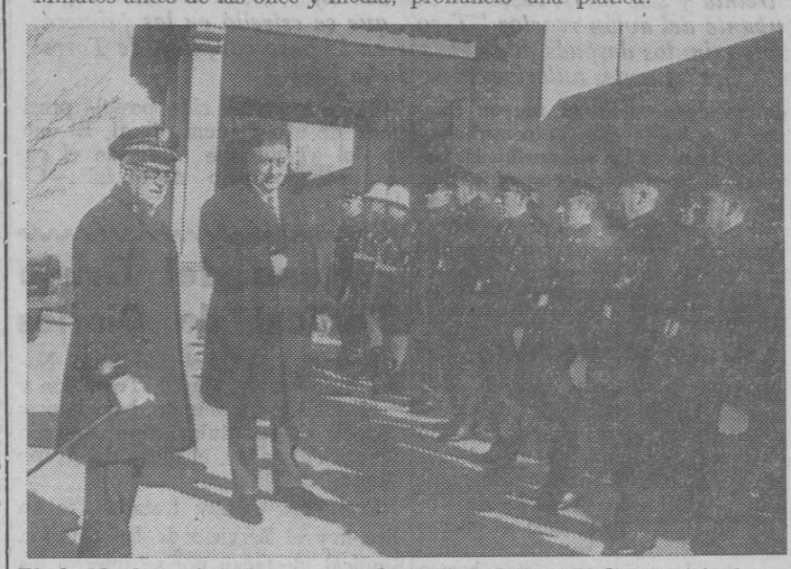
El alcalde de la ciudad, acompañado del jefe de la Guardia Municipal, pasa revista a la formación antes de iniciarse el acto religioso celebrado ayer en la capilla del cementerio.

Un cuarto de hora antes de la señalada para la celebración de la misa —11,30—, las fuerzas de la Policía Armada, con banderín y la banda de música de la Academia de Artillería, llegaron a la plaza de Franco, en formación, pasando a situarse en la calzada correspondiente a las Casas Consistoriales. Minutos antes de las once y media, La misa