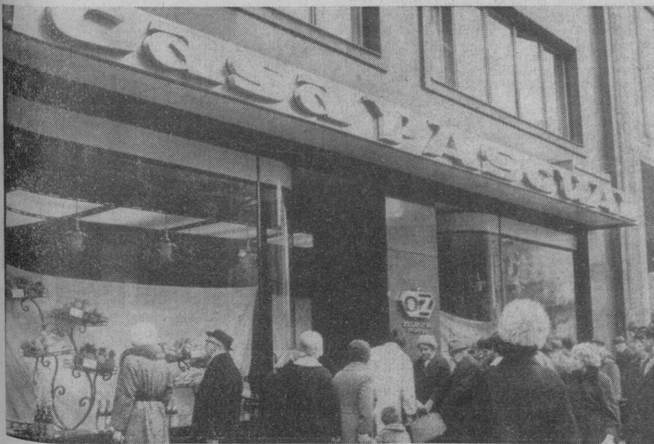
Los habitantes de Praga contemplan los productos frutícolas españoles (naranjas, limones, vinos y conservas) expuestos en la frutería de unos comerciantes valencianos en la calle Narodny, de Praga.