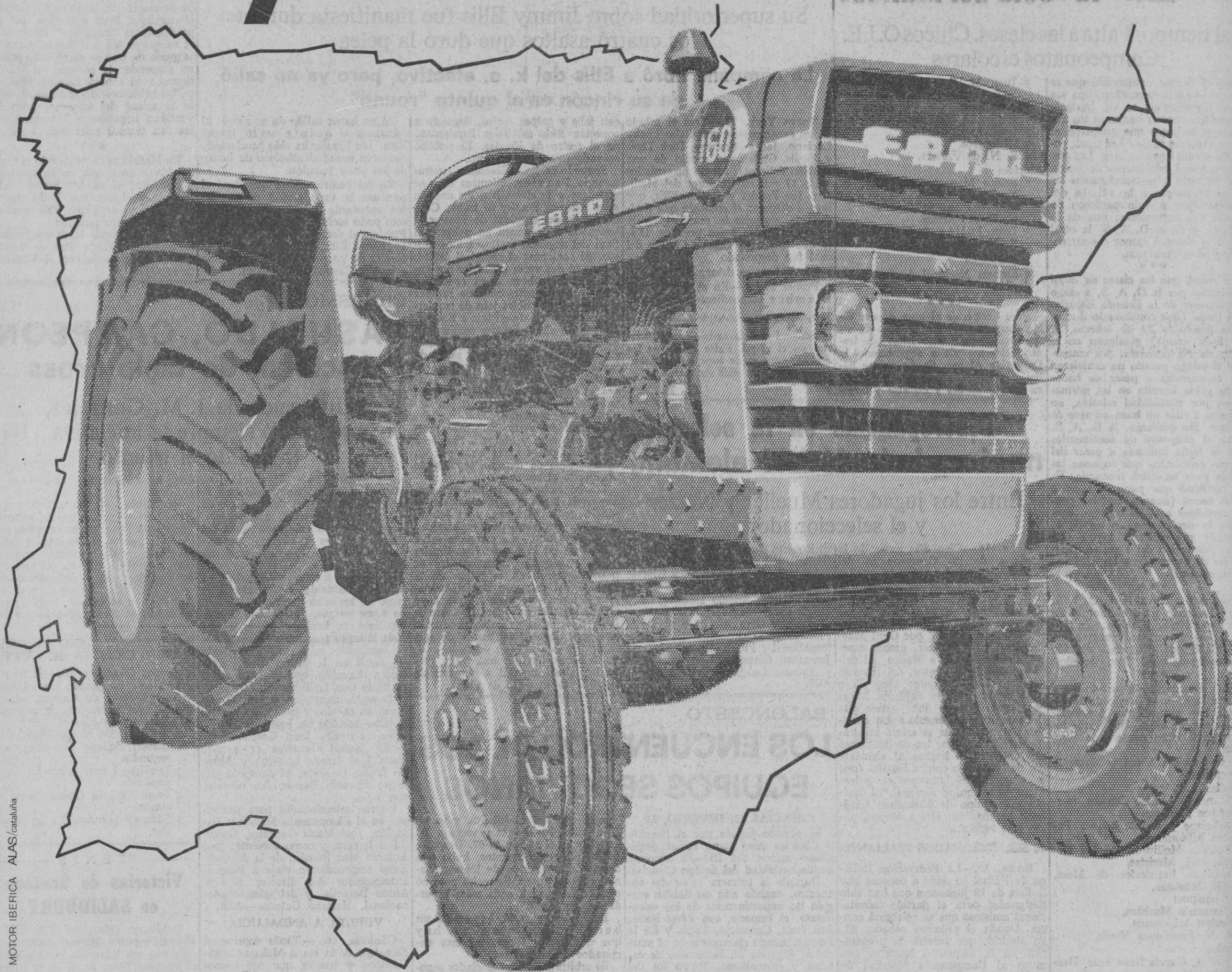
MOTOR IBERICA ALAS/cataluña