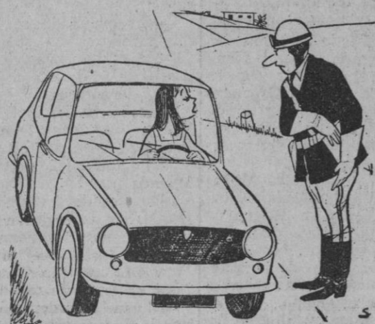
—La raya amarilla si la he visto. A quien no he visto ha sido a usted...