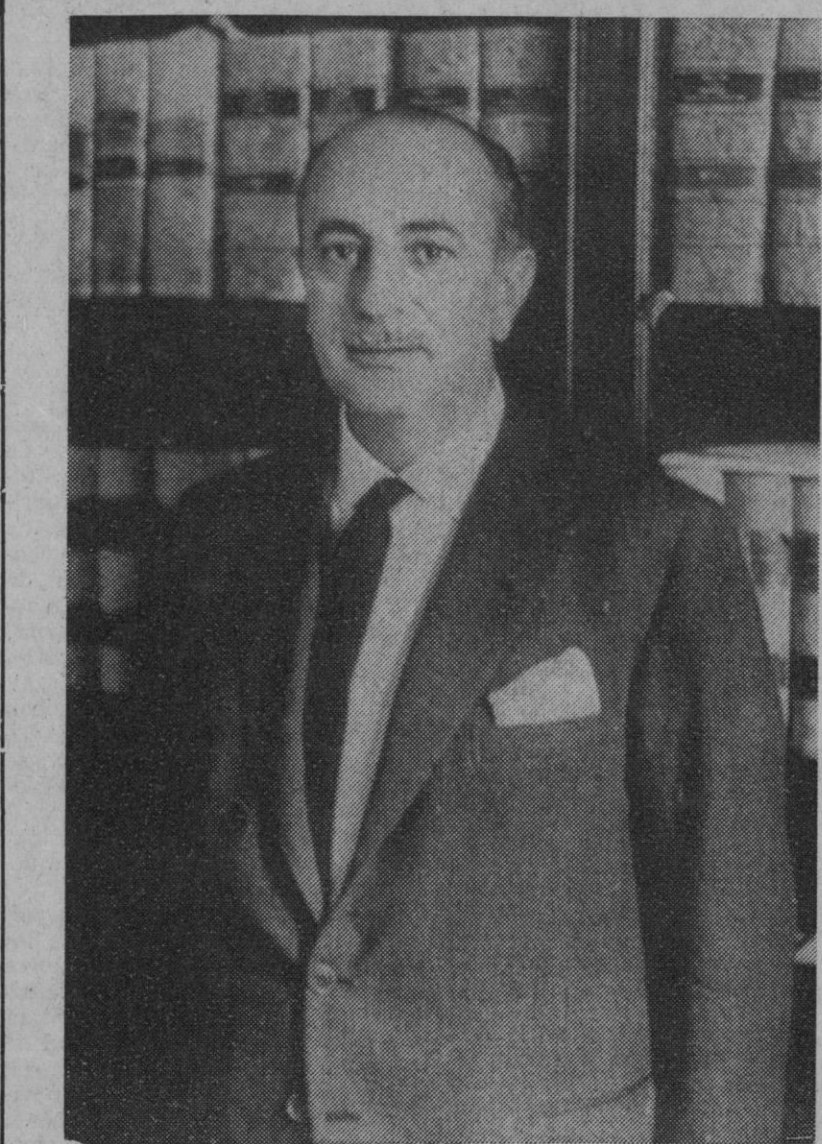
Don Alejandro Rodríguez de Valcárcel, presidente de las Cortes Españolas.

Finalmente: Como augurio de sus propósitos taurinos cara a la temporada próxima, informa el semanario sevillano que "El Cordobés" ha encargado ya un millón de fotografías suyas en color, del tamaño de un naipe, con un calendario al dorso en el que se leen estas palabras: "1970, año de 'El Cordobés'. ¡¡Feliz año para todos!!".—Cifra.