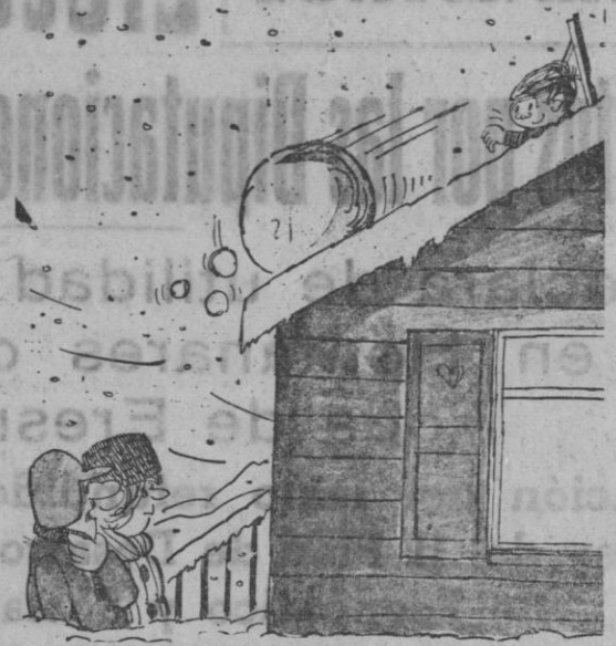
—Parece que tarda en abrirnos...

En lavadoras superautomáticas puede estar seguro si es Westinghouse CASA SOLERA