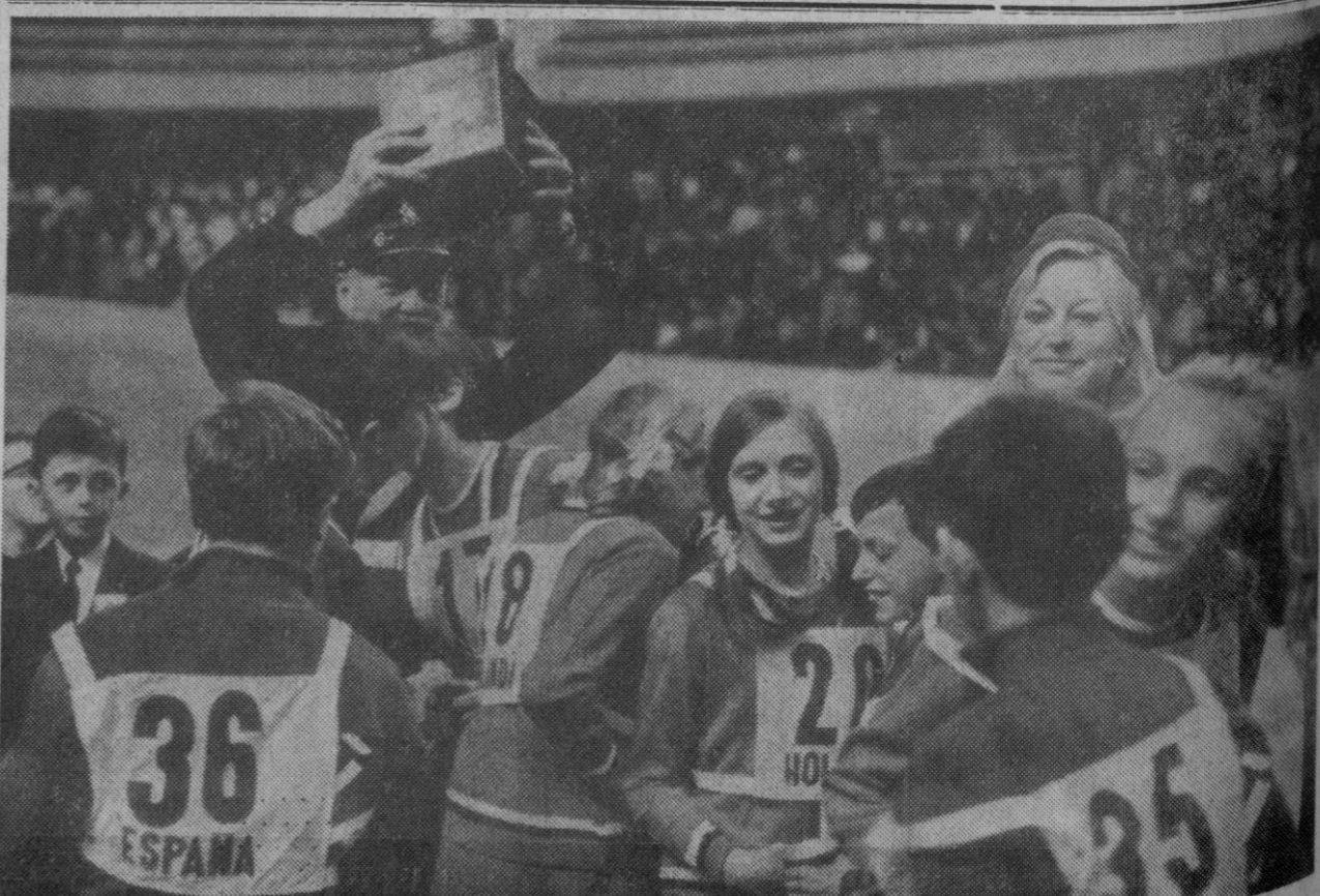
Madrid.—Los miembros del equipo español, vencedor absoluto del VII Copa Escolar Internacional de Parques Infantiles de Tráfico, desarrollada en el Palacio de los Deportes, entregan galantemente el trofeo de campeonas a las representantes del equipo de Holanda, únicas participantes femeninas del concurso.

CONDUCTOR: Aproximadamente el quince por ciento de los accidentes de tráfico en carretera, se producen por no circular por la derecha.