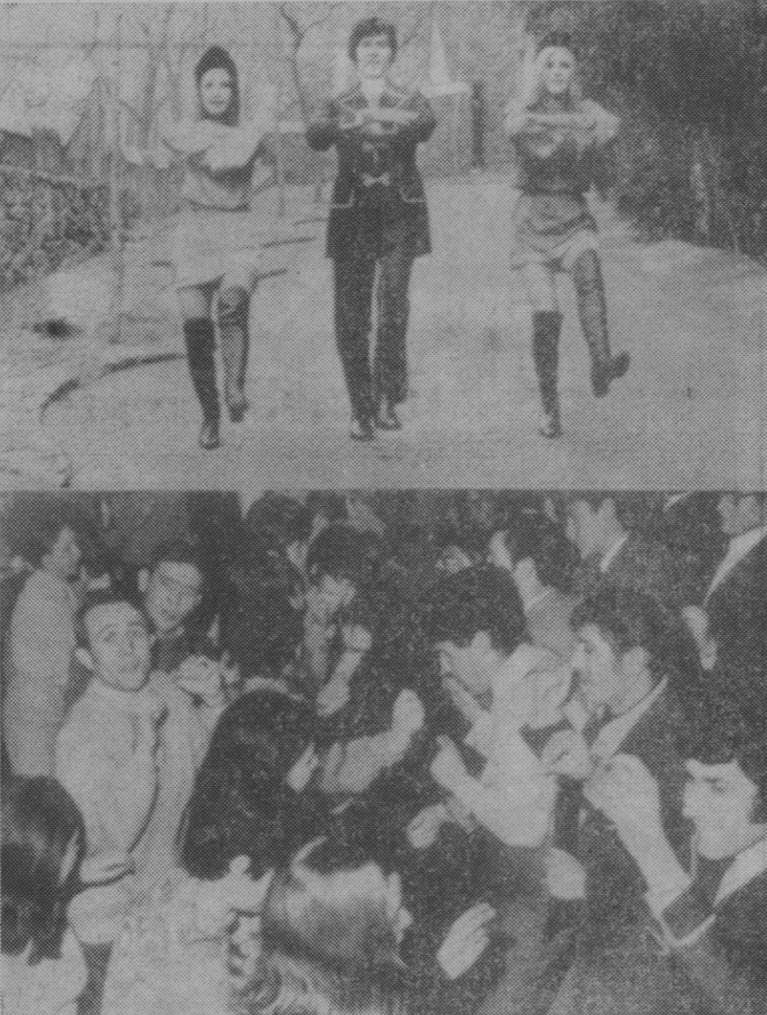
Arriba: Su creador, Georgie Dann, realizando unos pasos de «casastchok» al aire libre, acompañado de dos bellas jovencitas. Abajo: Los jóvenes aprenden a bailar este nuevo ritmo, inspirado en la música popular rusa.

Dentro de poco la juventud española habrá olvidado los actuales ritmos «ye-yé» y bailará al compás del «Casastchok» una nueva danza, con aires de «balalaika», inspirada en la música popular rusa, que ya está haciendo furor en varios países europeos.