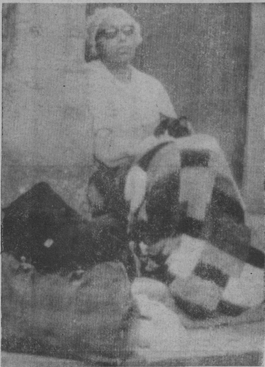
Briva (Francia).—La popular cantante Josefina Baker, aparece cubriéndose con una manta, sentada en las escaleras de su antigua casa, el castillo de Milandes, antes de haber sido desalojada, después de esperar cinco horas aquí.

Estamos, a mi juicio, en el mejor momento, dada la actual liquidez de nuestra economía, para iniciar este (Continúa en la página 6)