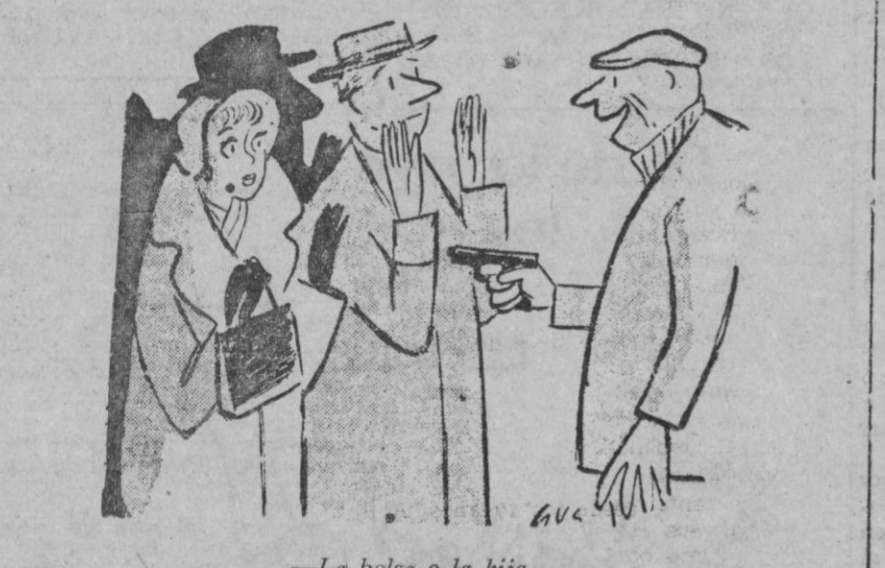
—La bolsa o la hija...

En lavadoras superautomáticas puede estar seguro si es Westinghouse CASA SOLERA